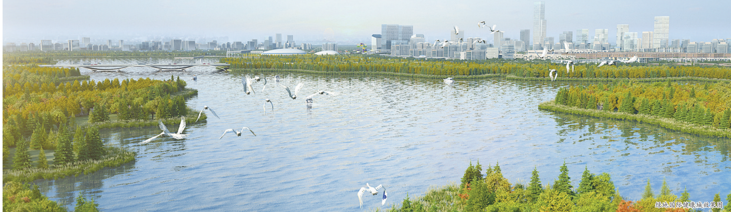
绿地国际健康城效果图

8月19日,南昌市红谷滩区重大项目集中签约、开工仪式在九龙湖新城举行。当天南昌VR科创城中央湖景观工程正式开工,VR科创城项目整体建设再次按下“快进键”。而在城市的另一端,赣江新区儒乐湖新城,天蓝云白、花红柳绿、林木葱茏,儒乐湖公园景色郁郁葱葱,处处一派生机盎然。