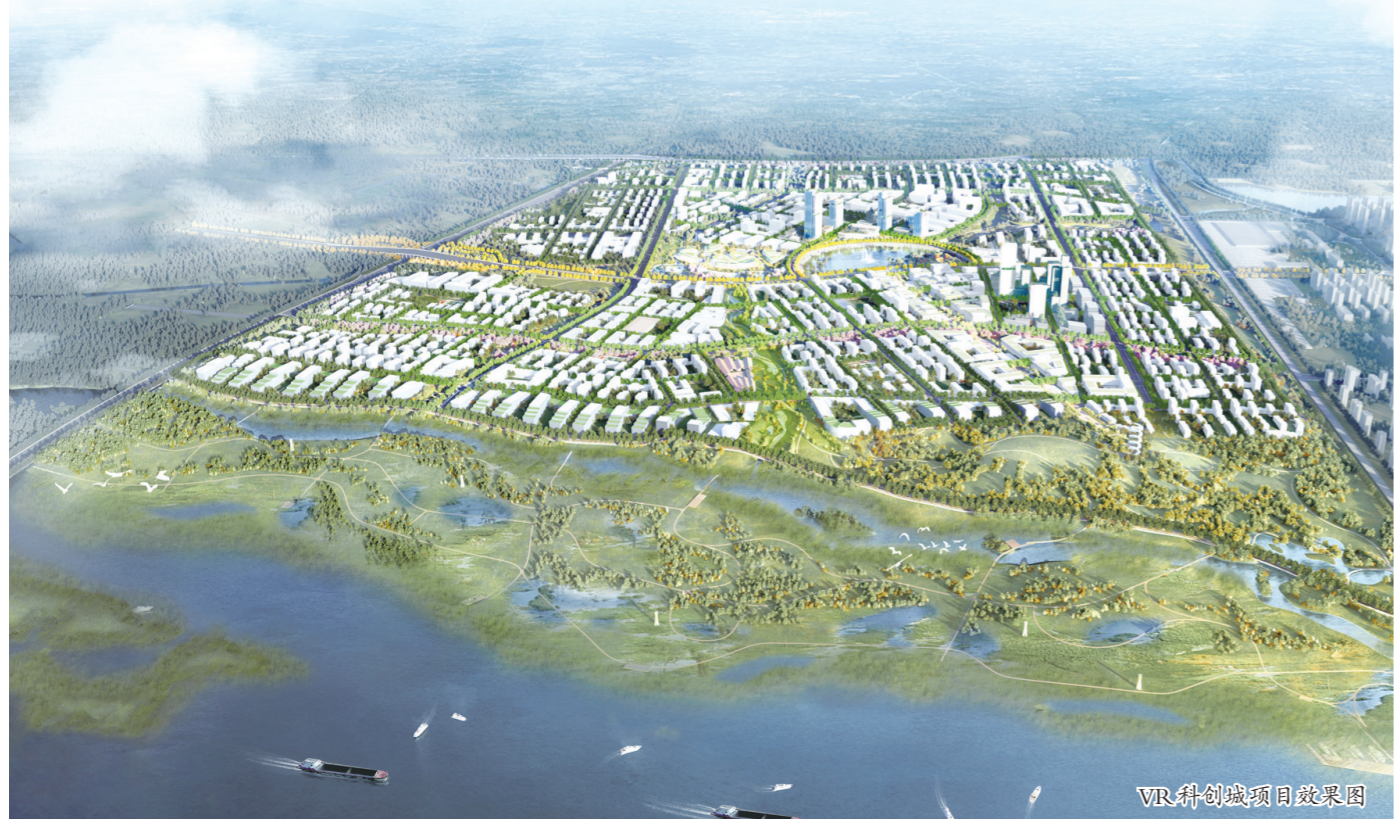
VR科创城项目效果图

一个是承载江西绿色崛起的国家级新区,一个是代表江西创新经济发展的新未来区域,赣江新区和九龙湖科创城板块将持续成为城市发展的热点区域。