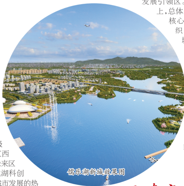
儒乐湖新城效果图

绿地把握产业发展趋势,促进优质产业资源集聚,并以科创产业、医疗健康产业、全球贸易港等为具体抓手,推动绿地国际健康城、南昌VR科创城快速呈现,再造城市新中心。