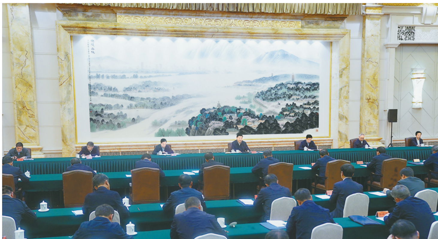
11月14日,中共中央总书记、国家主席、中央军委主席习近平在江苏省南京市主持召开全面推动长江经济带发展座谈会并发表重要讲话。