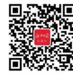
江西日报特刊部重磅打造 江西日报新媒体微信公众号

分析师胡小凤预计,临近年末,银行在激烈的揽储竞争以及降成本的双重压力下,整体利率波动不会太大,但年末资金紧张,定期存款利率可能会继续上行。对于投资者来说,如对流动性要求不高,应优先考虑中长期存款。(于 喻)