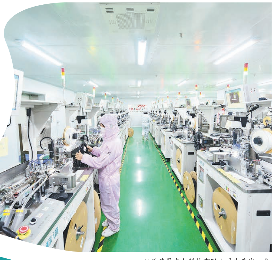
江西瑞晟光电科技有限公司生产线一角

一项项改革措施落地生根，一个个百姓愿望得到实现，一批批重点项目开花结果……素有“长江明珠、祥瑞之城”之称的瑞昌，让群众在不断升温的“民生温度”中感受满满的幸福，“美好瑞昌”愿景逐步成为现实。 近年来，瑞昌市紧紧围绕“实干创新、五大升级、全面小康、美好瑞昌”发展思路，持续打造城乡卫生、社会安全、自然生态、诚信人文、政务服务“五好环境”，深入推进工业发展、对外开放、秀美乡村、城市管理、民生共享“五大升级”，有效化解疫情和汛情的双重冲击，奋力谱写高质量发展新篇章。 今年，瑞昌市获评全省2019年度高质量发展先进一类县(市、区)和2017—2019年全省开放型经济综合先进一类县(市、区)，是全省唯一获评“双料大奖”的县区；四次跻身全省高质量发展先进县市区；获评全省“第四届十佳优化营商环境县(市、区)”，瑞昌经济开发区获评全省第一届十佳优化营商环境工业园区。 赶超倍增，成绩不易。今年1至10月，完成财政总收入36.57亿元；完成固定资产投资222.36亿元，增长8.1%；规模以上工业营业收入466.5亿元，增长6.6%；规模以上工业利润总额55.9亿元，增长6.2%；实际利用外资2.7亿美元，增长6.5%。