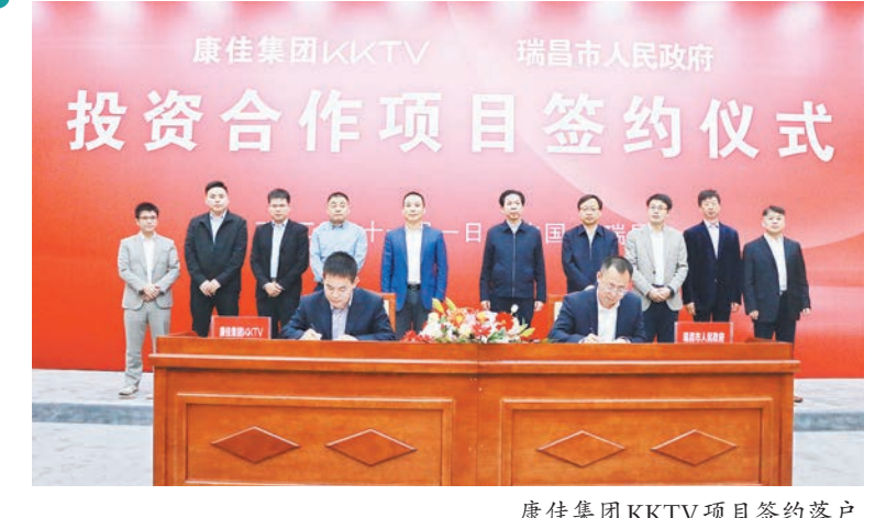
康佳集团KKTV项目签约落户