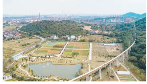
亚东水泥公司绿色矿山

推进生态环境“大提升”。在“线上”攻坚。坚持一体打造19.5公里最美长江岸线，最美赤湖岸线，推动生态绿廊串点成线、节点贯通。按照“堤外生态湿地、堤内景观园林”要求，新增复绿面积3200亩。先后拆除长河、赛湖等禁养区内养殖场355家，确保一湖清水入长江。大力推进城市线网整治、城市水环境综合整治行动，码头工业城污水处理厂提标改造项目建成运营，城乡生态更加美好。在“点上”发力。投入4000万元，精心打造天翻山公园，让度废弃矿山生态修复；投入1.1亿元，完成47家废弃矿山生态修复；投入3.2亿元，完成6家绿色矿山创建。在“面上”突破。统筹推进城市、农村、园区生态建设，着力提升发展的“含绿量”“含金量”。 构建长效常治“大格局”。强化资金保障。2016年以来，累计投入10.25亿元用于生态环境保护工作，足以表明瑞昌抓环保、优生态的信心和决心。强化机制保障。建立健全全年度推进、联合执法、督查问效等机制，压实工作责任，强化跟踪问效，始终保持高压态势。