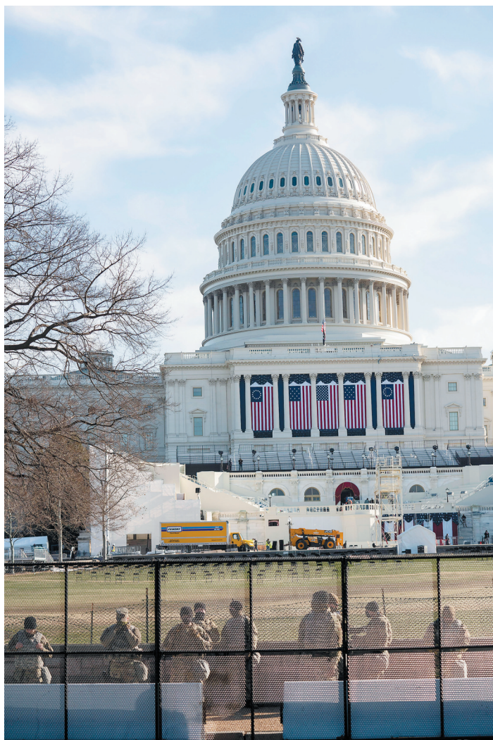
1月13日,国民警卫队队员在美国华盛顿国会大厦外警戒。