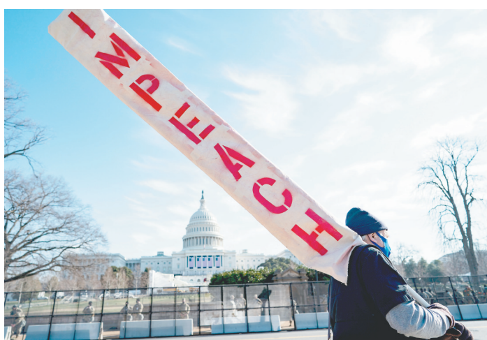
1月13日,在美国首都华盛顿,一名手持“弹劾”标语的男子从国会大厦前走过。

为保障总统就职典礼前后的安全,美国首都华盛顿警方13日宣布,部署到华盛顿的国民警卫队队员将超过2万人。