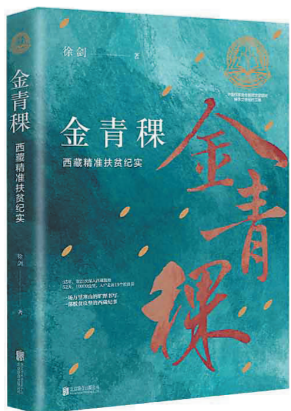
《金青稞：西藏精准扶贫纪实》 徐剑 著 北京联合出版公司

写。他从藏东昌都入，沿317国道，入藏北、走大环线，再从无人区挺进阿里，然后入后藏重重地日喀则，最后到拉萨、山南、林芝，走完西藏最后19个脱贫县，等于环西藏高原走了一个圆环。从繁华走进荒凉，从都市走向山村。一路向西，海拔不断升高，许多地方都在5000米之上，很多时候他都置