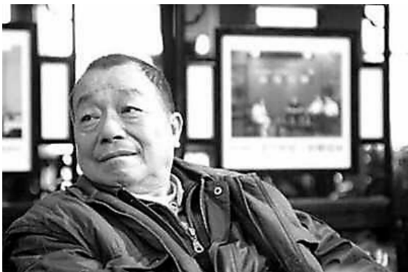
《也无风雨也无晴》 沈昌文 著 海豚出版社