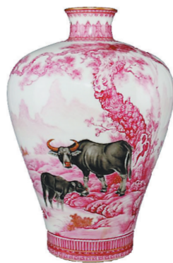
图②:红彩母子牛梅瓶