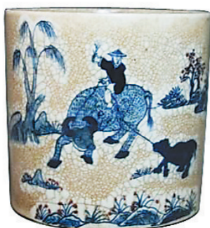
图③:青花瓷牛纹笔筒

笔洗看牛。这是一件清代仿宋汝窑内刻牛纹洗(图①),高约3.2厘米,花口,撇足,器型雅致,色泽莹润,釉如凝脂。外壁呈花瓣状,一头彪悍的犍牛雕刻于洗底,牛角高挺,牛尾轻翘,四蹄奋进,仿佛腾云驾雾,呼啸而至。汝窑是宋代五大名窑之一。汝瓷小巧朴素,温