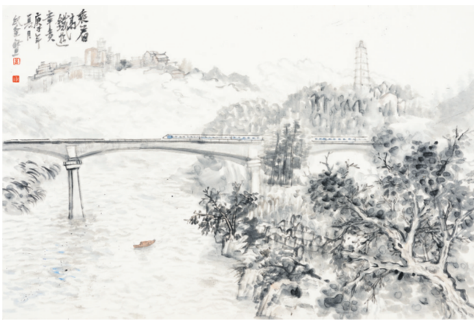
国画《乘着高铁游章贡》曾纪全绘