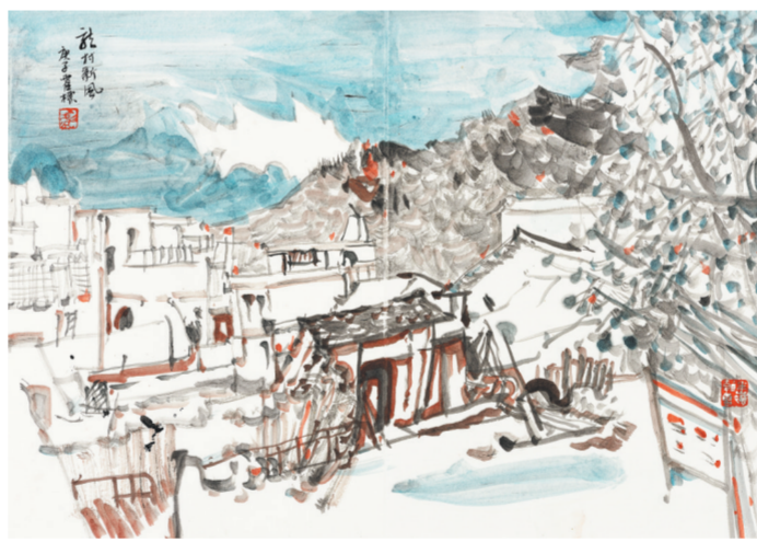
国画《龙村新风》霍标绘