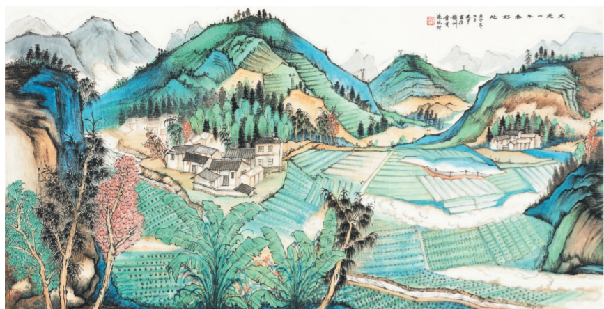
国画《又是一年春好处》陈建中绘