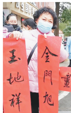
社区居民喜领春联

和本报共同主办的“四方安乐迎新岁,百副春联颂党恩”迎新春送春联活动,在南昌县八月湖街道幸福时光社区举行。在社区的民情连心桥服务点,翰墨飘香,福满大堂,书法家现场挥毫泼墨,为社区群众免费写春联送祝福。