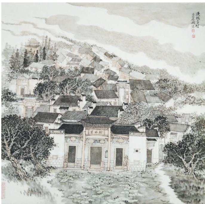
国画《汉陂古村》涂传斌绘