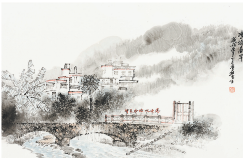
国画《凌源春早》詹艺绘