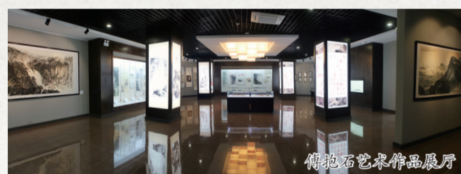
傅抱石篆刻作品展厅

傅抱石是篆刻艺术的奇才,其微雕达到了顶峰水平,在不用放大镜的状态下,完全凭感觉进行雕刻。在日本留学时,他举办了“傅抱石书画篆刻个展”,篆刻作品在日本艺术界引发强烈反响。他一生治印4000余方,迄今有记载的微雕印章共有9枚,其中最出名的是“采芳洲兮杜若”印。“采芳洲兮杜若”鸡血石印章,在长仅4厘米、宽仅2.8厘米的狭小空间里,刻有屈原《离骚》2765字,被誉为“神刻”“精神雕刻”,一举夺得全日本篆刻大赛冠军。把此作品放大数百倍,行距清晰,排列整齐,字字雄健,犹如古代碑刻,堪称稀世珍宝。