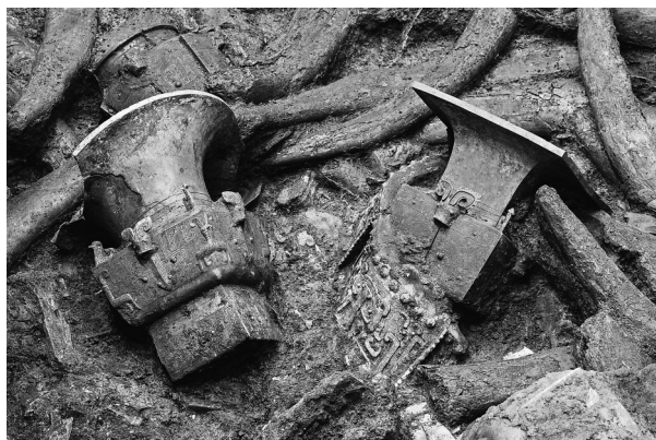
这是三星堆遗址考古发掘现场3号“祭祀坑”内拍摄的青铜器和象牙(3月16日报)。

古蜀文明之光，再次闪耀于中华文明版图西南部。黄金面具、青铜人像、青铜尊、玉琮、玉璧、金箔、象牙……20日，“考古中国”重大项目工作进展会在成都举行，通报了四川广汉三星堆遗址重要考古发现与研究成果。新发现的6座三星堆文化“祭祀坑”，目前已出土500余件重要文物。