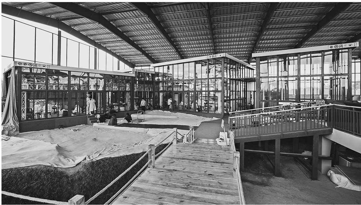
这是在三星堆遗址考古发掘现场内拍摄的4个工作舱(3月10日报)。