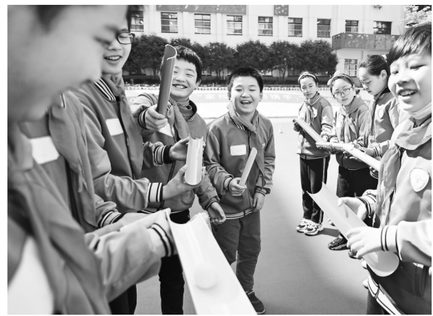
3月24日,南昌市妇女儿童活动中心联合南昌市邮政路小学教育集团,在邮政路小学开展“六心家园”家庭教育推广计划,让广大学生健康快乐成长。

“好家规好家风”带动“好村风好乡风”。近年来,大余在创建全国文明城市和推进乡风文明建设过程中,大力倡导良好家风家训。在全县所有村(社区)建立了道德讲堂,积极开展“身边好人”“最美家庭”等评选活动,用身边事教育身边人,让优秀文化引领时代新风尚,为经济社会发展提供强大的精神动力和文化支撑。