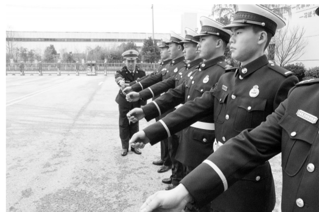
3月25日,抚州高新区消防救援大队组织全体指战员开展队列训练,提升队伍正规化建设水平。

抚州青年创新汇论坛由江报传媒抚州事业部发起,以江报全媒体互动体验馆为物理空间,搭建一个抚州青年创新创业的平台。抚州青年创新汇前期以SYB培训、教育培训机构等落地项目为出发点,组建当地专业化高素质职业指导师资队伍,培训有创业就业需求的准毕业生、职场新人。