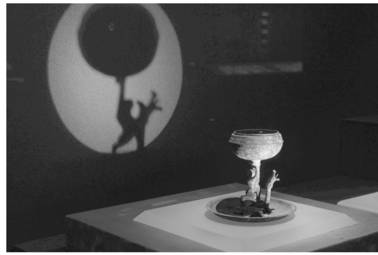
▲马蹄金。 ▲青銅器。