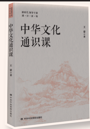
▲《中华文化通识课》王蒙著 中共中央党校出版社

月里,汉字的形体虽屡有变异,却一脉相承,成为中华民族人文精神与伦理价值的载体,有艺术的美感。汉字六书的既表音、表形又表意的多元综合结构信息,培养了中华民族思想方法的整体主义,成为不受地域与方言分割而统一全国的文化手段。汉字讲究笔墨几何图形与运势结构形态,以汉字为载体的书法艺术,历经殷商甲骨、两周金石、秦汉篆隶、晋唐行草的演变,已经成为世界上独一无二的艺术形式,并被载入联合国教科文组织人类非物质文化遗产代表作名录。”