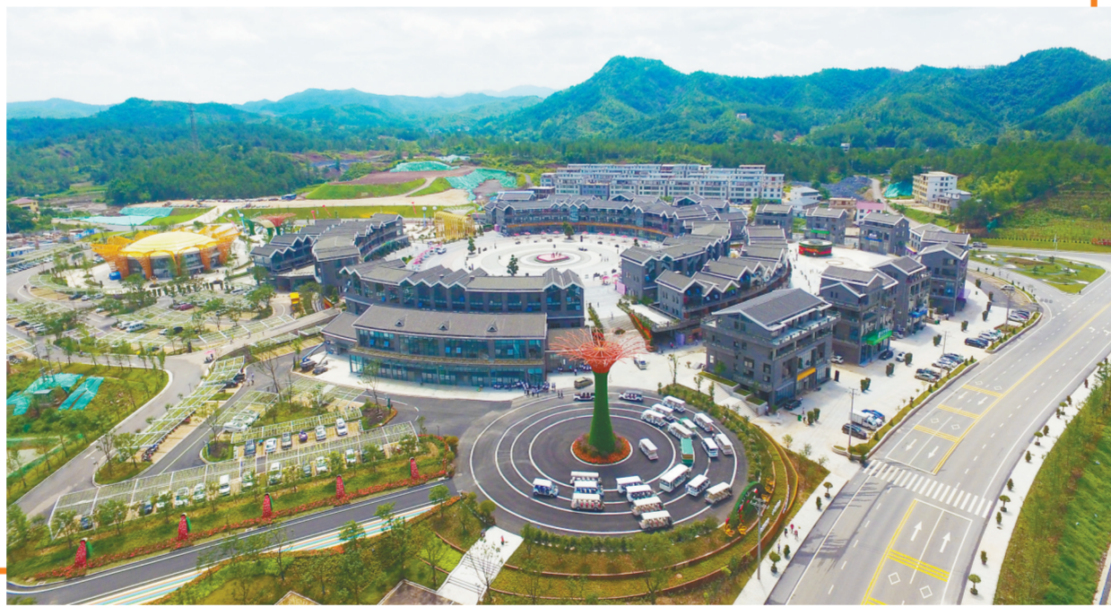
现代气息浓厚的中国花谷·小密花乡试验区。