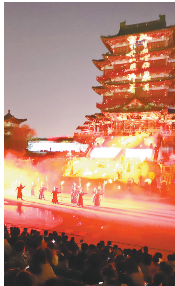
《寻梦滕王阁》演出现场。

白天日均入园人数，从2月份的2600人次，到3月初的3400人次，再到3月中旬的4700人次，3月21日突破7000人次……滕王阁夜色美，白天更精彩。