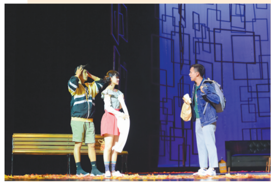
《外公的咖啡时光》在会昌上演。