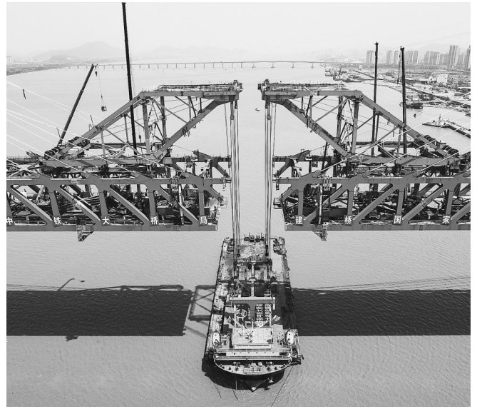
杭绍台铁路椒江特大桥顺利合龙

4月17日,杭绍台铁路椒江特大桥合龙现场。当日,在浙江台州的杭绍台铁路建设施工现场,随着最后一块钢梁吊装完成,杭绍台铁路控制性工程椒江特大桥顺利合龙。杭绍台铁路是我国首条民营资本控股的高速铁路项目。该线路连接浙江杭州、绍兴和台州三地,线路设计时速350公里。