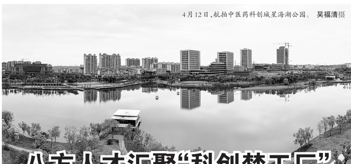
4月12日，航拍中医药科创城星海湖公园。

更让护鱼队队员高兴的是，吴城镇不但生态环境日益好转，借着“候鸟小镇”建设的东风，当地的旅游业也兴旺起来。如今，镇里精心打造的3处观鸟点已经开放迎客，游客中心、星级酒店正在加紧建设，仿古街上的游客络绎不绝。