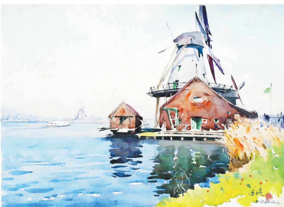
水彩画《荷兰风车村》 漆德琰绘

国画和水彩画在用笔用水中有着许多共同之处。漆德琰喜用毛笔画水彩,中锋和侧锋运用自如,笔法笔触变幻丰富。由于对中国传统艺术的酷爱,加上扎实的国画功底,他的水彩画具有浓厚的中国气派,风景画所呈现出的格调,有中国传统审美的诗意和悠远的意境,色调中具有柔和渐进之感,流露出作者追求安静祥和的心境和境界,如2000年创作的《嘉陵江畔》等。