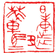
作者临《日庚都萃车马》