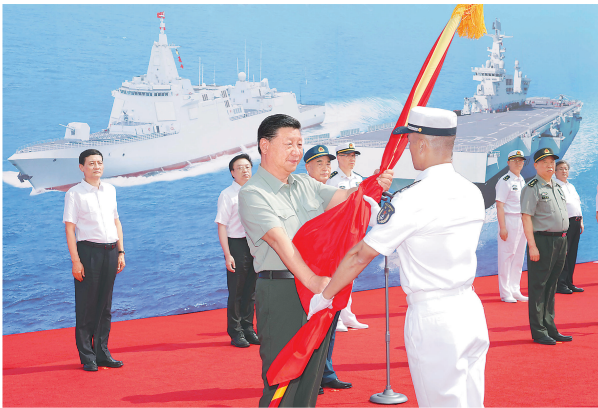
4月23日,海军三型主战舰艇——长征18号艇、大连舰、海南舰在海南三亚某军港集中交接入列。中共中央总书记、国家主席、中央军委主席习近平出席交接入列活动并登上舰艇视察。这是习近平向长征18号艇授予军旗、命名证书。