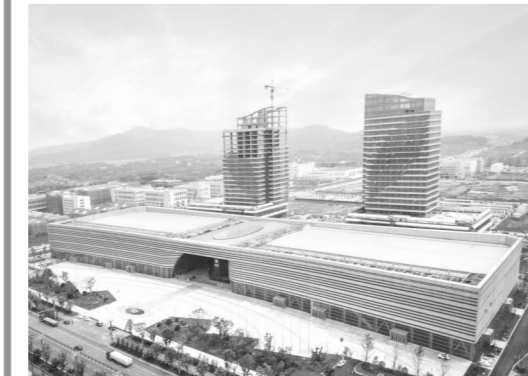
中医药科创城会展中心,总建筑面积达18万平方米