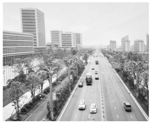
改造后的主干道新祺周大道面貌焕然一新