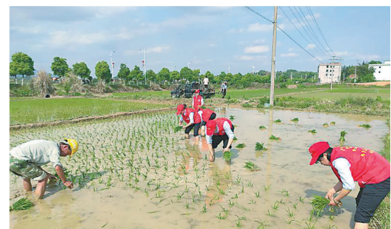
近日，赣州市宁高高速黄陂收费站青年志愿者帮助农户插秧，既锻炼了职工吃苦耐劳的精神，又解决了群众的燃眉之急。