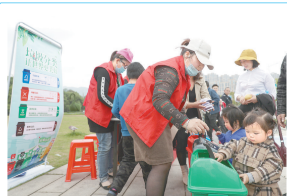
4月20日，南昌市湾里管理局磨盘山森林公园，磨盘山社区志愿者引导游客养成垃圾分类投放垃圾的文明习惯。

为确保民生实事项目落细落实，今年以来，幽兰镇纪委以项目实施指标任务为导向，完善监督措施，聚焦民生实事项目开展专项监督活动。为压实监督责任，镇纪委制订方案，明确工作目标、监督重点、方法步骤和保障措施，将具体监督任务量化到岗、细化到人，实现监督检查干部人人有任务，民生实事项目事事有监督。同时，采取“销号监督”方式确保项目实施进度，对落实推进缓慢、未按时完成的项目查明原因，对症下药，确保项目早日落实到位，惠及百姓。