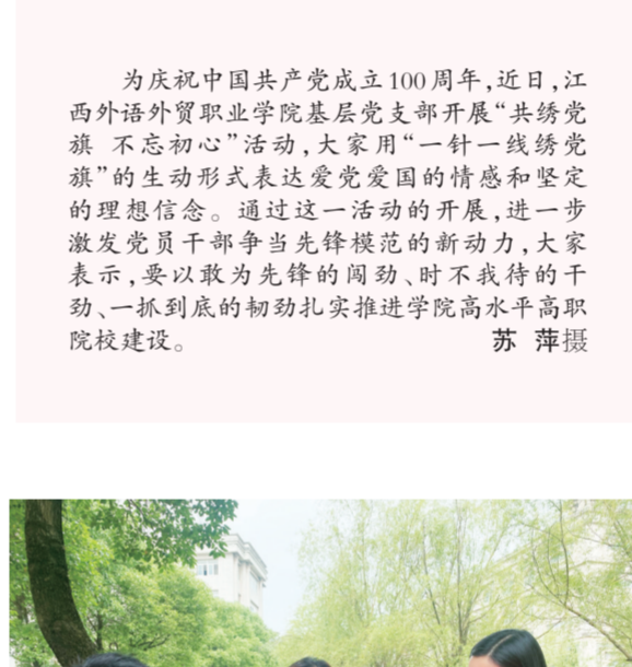
为庆祝中国共产党成立100周年，近日，江西外语外贸职业学院基层党支部开展“共绣党旗 不忘初心”活动，大家用“一针一线绣党旗”的生动形式表达爱党爱国的热情和坚定的理想信念。通过这一活动的开展，进一步激发党员干部争当先锋模范的新动力，大家表示，要以敢为先锋的闯劲、时不我待的干劲、一抓到底的韧劲扎实推进学院高水平高职院校建设。

三清山风景名胜区始终坚持“人民至上、教育优先”的发展战略，践行立德树人的教育理念，着力推动义务教育优质均衡发展。去年以来，三清山风景名胜区对三清山学校进行了校园功能品质提升，立足于山区、景区的地方特色，专门增设了地质教室、全域共享课堂以及木艺技能室，生均功能室面积、生均设备值达标率100%。这些功能室的建成，不仅激发了山区孩子对家乡文化、地质科学、生态环境的热爱，还可作为世界地质公园、省级研学教育实践基地、省级科普教育基地的重要支撑和补充，充分发挥地质科普、研学旅游、文化交流的多重效应，师生参与研学率达100%，形成了“研学校区、旅游景区、地质园区”全域共融的发展体系。