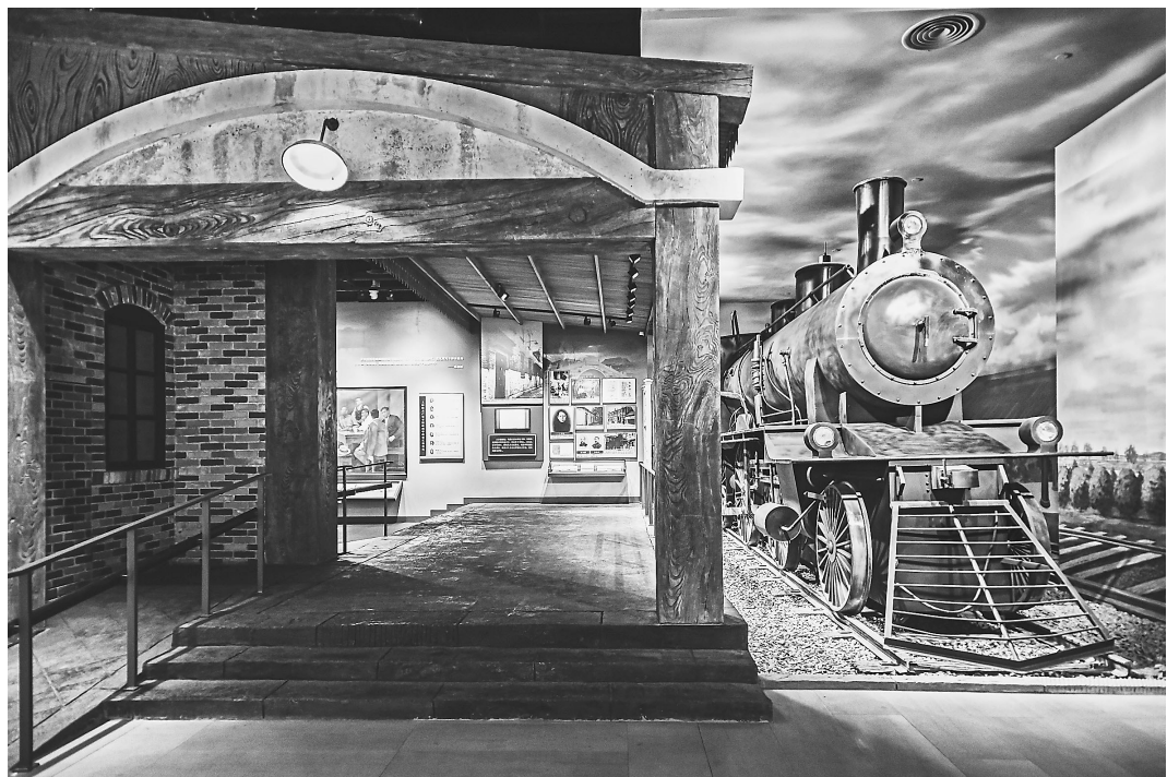
6月5日，位于浙江嘉兴南湖革命纪念馆主题展《红船起航》开展。《红船起航》主题展由“救亡图存”“开天辟地”“光辉历程”“走向复兴”等4个部分、21个单元组成，并设“中共一大代表人生轨迹”“中国共产党党章发展历程”两个专题。