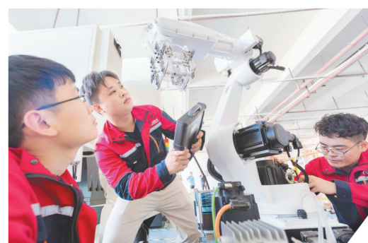
智能制造产业园内套嵌科技技术人员在安装调试机械臂

如今，拍摄基地因为真实再现“三湾改编”历史场景，已成为党史学习教育和青少年研学游的热门景点。下一步，永新县将结合红色培训对其进行旅游提升和业态注入，打造成三湾改编景区的新亮点。