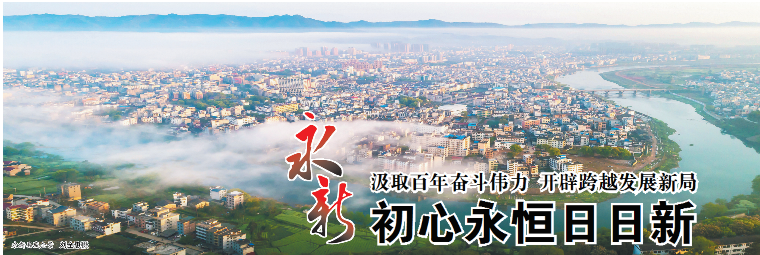
永新县城全景 刘全惠摄