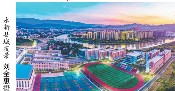
永新县城夜景

罗霄腹地，湘赣之边。山风正劲，浪潮奔涌。永新，这片红色的热土，“忠、勇、信、义”的人文精神在人们的血液中流淌。革命战争年代，这里走出了41位开国将军。毛泽东在《井冈山的斗争》一文中提及“用大力经营永新”，将其视作井冈山革命根据地的重要组成部分。如今，这又是一座快速发展的创新之城。“十三五”期间，永新县贯彻新发展理念，推动产业转型升级，GDP年均增长8.5%以上，人均GDP突破2.3万元，经济实力迈上新台阶，县域整体贫困和绝对贫困问题得到历史性解决，城乡面貌焕发新的气象，社会治理取得新的成效，人民生活实现新的进步。 2021年以来，永新县深入贯彻落实习近平总书记视察江西重要讲话精神，明确“六个赶超发展、四个奋勇争先”工作要求，以红色基因化作前行动力，强化科技创新，着力深化改革开放，加快推进高质量跨越式发展，迈出打造“湘赣边界高质量发展示范县”的铿锵步伐。