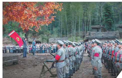
电影《三湾改编》在三湾乡甌潭村拍摄

1927年，中国大地上，风雷激荡。“秋收时节暮云愁，霹雳一声暴动。”这一年的9月9日，爆发了中国共产党人向国民党反动派宣战的秋收起义。