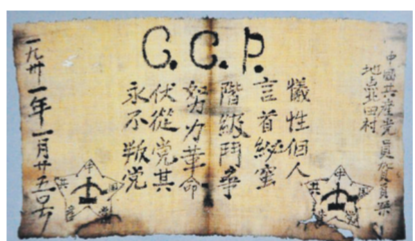
贺页朵入党誓词原件图片资料

心，凝结着中国共产党人历经硝烟却初心不改的珍贵品格，对于今天人们传承红色基因、从历史中汲取奋进力量有着特殊的意义。