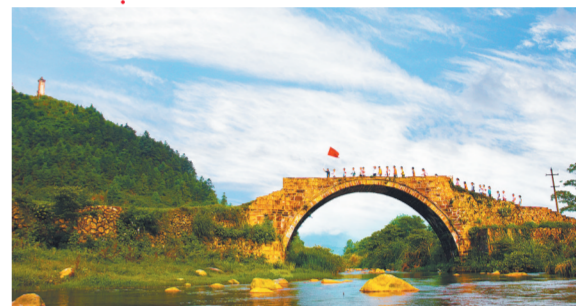
龙源口大捷桥

罗霄腹地，湘赣之边。山风正劲，浪潮奔涌。永新，这片红色的热土，“忠、勇、信、义”的人文精神在人们的血液中流淌。革命战争年代，这里走出了41位开国将军。毛泽东在《井冈山的斗争》一文中提及“用大力经营永新”，将其视作井冈山革命根据地的重要组成部分。如今，这又是一座快速发展的创新之城。“十三五”期间，永新县贯彻新发展理念，推动产业转型升级，GDP年均增长8.5%以上，人均GDP突破2.3万元，经济实力迈上新台阶，县域整体贫困和绝对贫困问题得到历史性解决，城乡面貌焕发新的气象，社会治理取得新的成效，人民生活实现新的进步。 2021年以来，永新县深入贯彻落实习近平总书记视察江西重要讲话精神，明确“六个赶超发展、四个奋勇争先”工作要求，以红色基因化作前行动力，强化科技创新，着力深化改革开放，加快推进高质量跨越式发展，迈出打造“湘赣边界高质量发展示范县”的铿锵步伐。