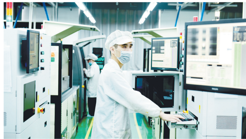
彩智电子科技(江西)有限公司生产车间

壮大集体经济,农村发展才有“后劲”。该区充分依托各村拥有的自然资源、经济基础、人文特色等,探索多形态的村级集体经济合作模式,积极开发、培育特色产业,如潢溪镇渡口村的物业公司、平定乡洪桥村的红薯种植加工等,促进了村级集体经济可持续发展,带动村民共同富裕。该区还同江西农业大学签订产学研战略合作协议,做好农业产业规划,重点打造“水稻+”、中药材和观光休闲三大产业集群,被农业农村部列入水产产业集群项目县。2020年,全区所有行政村集体经济经营性收入超5万元,春涛镇高坊村获批全国“一村一品”示范村。