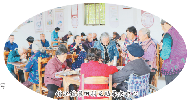
锦江镇范家村互助养老中心