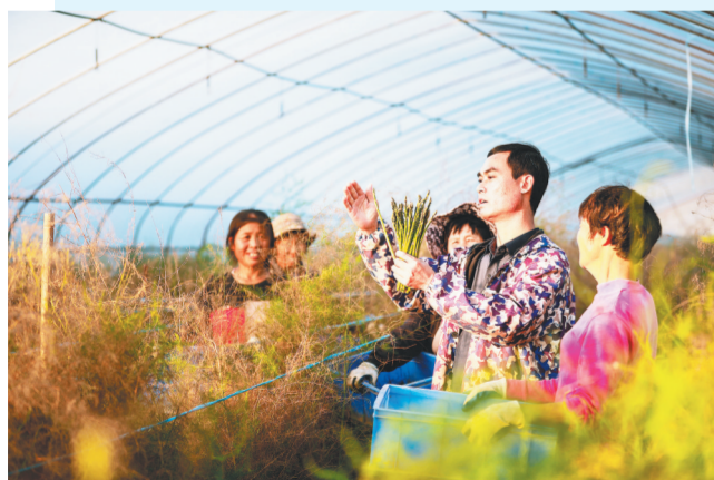
杨溪芦笋特色产业