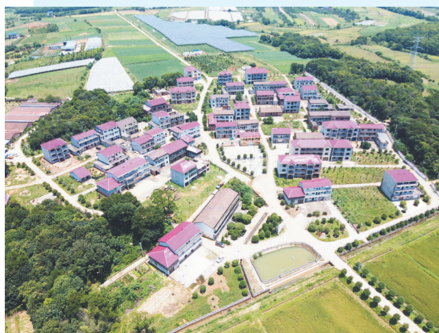
平定乡洪桥村鲁王小组新景