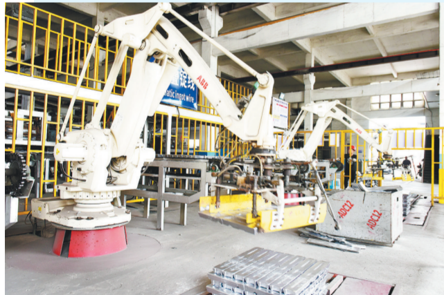
江西保太集团铝合金锭车间的机器人叠锭机