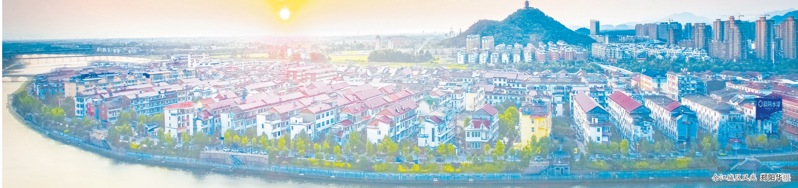
余江城区风貌