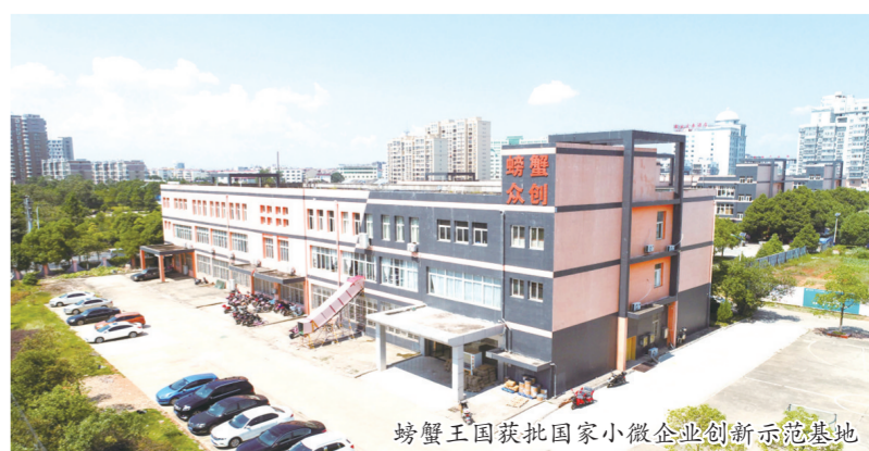
螃蟹王国获批国家小微企业创新示范基地