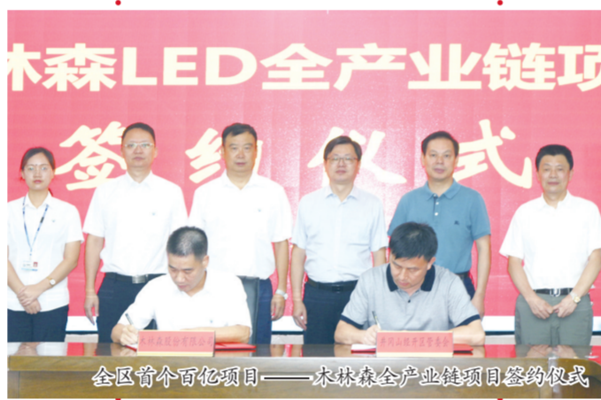
全区首个百亿项目——木林森全产业链项目签约仪式

统计数据显示，2020年，井冈山经开区“一区四园”实现业务收入1107.8亿元，同比增长6.4%；实现财政总收入达27.4亿元，同比增长5.3%。电子信息产业产值占全省的五分之一。在当年国家级经开区综合发展水平考核评比中居第66位，已连续4年保持百强席位。