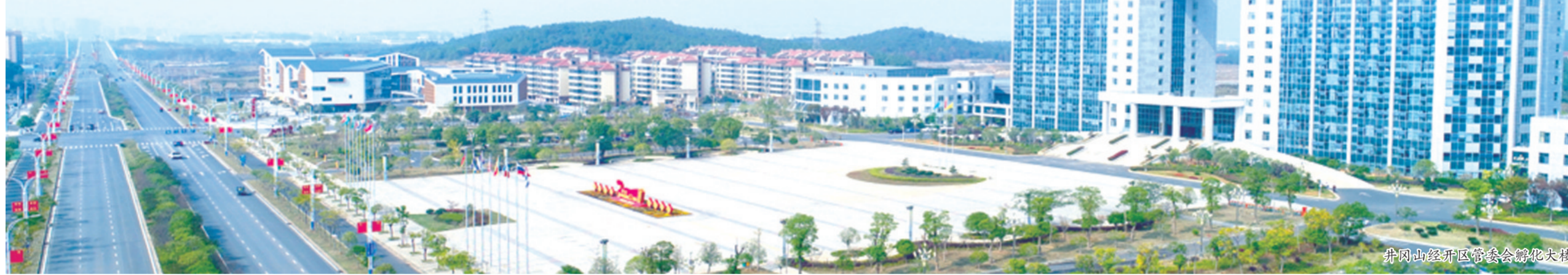
井冈山经开区管委会孵化大楼

放眼“十四五”，井冈山经开区提出，要全力打造“革命老区开发区改革创新示范区”，预计2021年营业收入突破1000亿元，财政总收入增长10%，突破30亿元。力争到2025年，营业收入突破2000亿元，财政收入力争突破50亿元，综合考核评价进入国家级经济技术开发区优秀行列。东方风起，未来已来。井冈山经开区人正以自强不息的磅礴动力，通过改革激发创新，创新引领发展，拥抱全新未来。