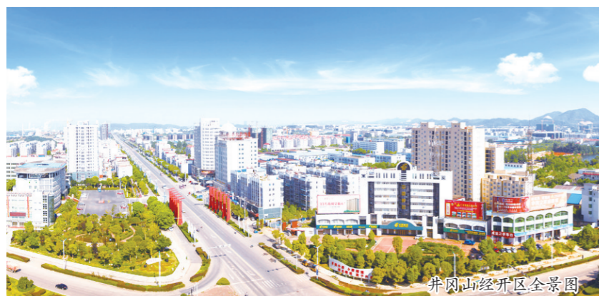
井冈山经开区全景图