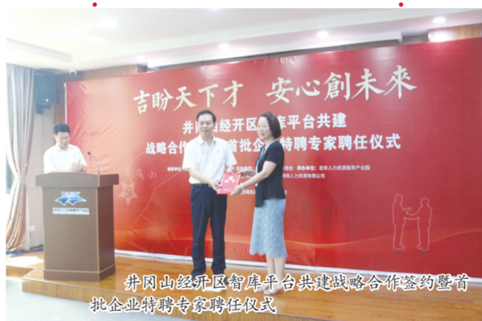
井冈山经开区智库平台共建战略合作签约仪式暨首批企业特聘专家聘任仪式