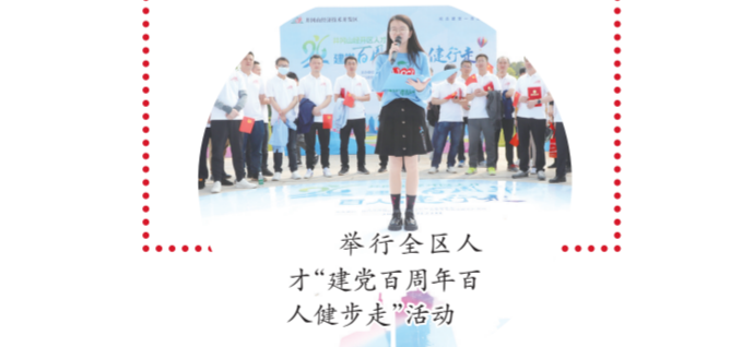
举行全区人才“建党百年百人健步走”活动