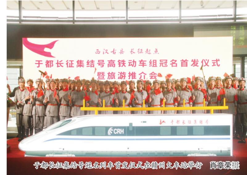
于都长征集结号冠名动车组首发仪式暨旅游推介会