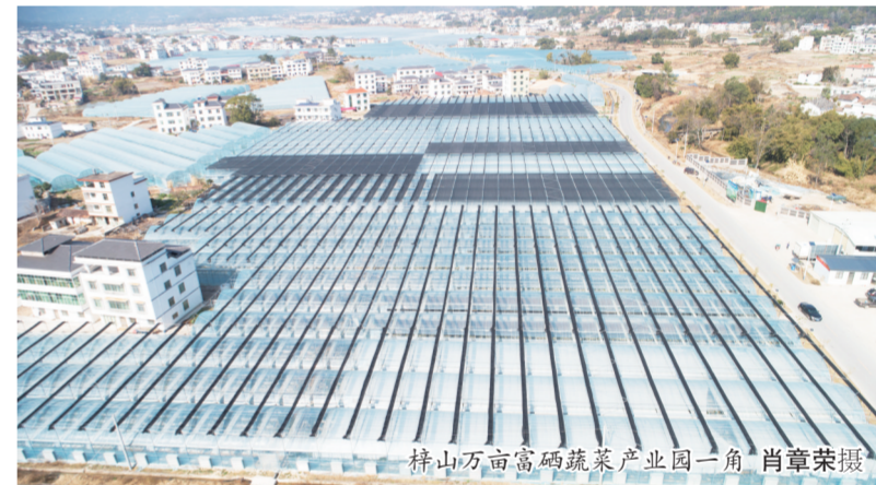
梓山万亩富硒蔬菜产业园一角