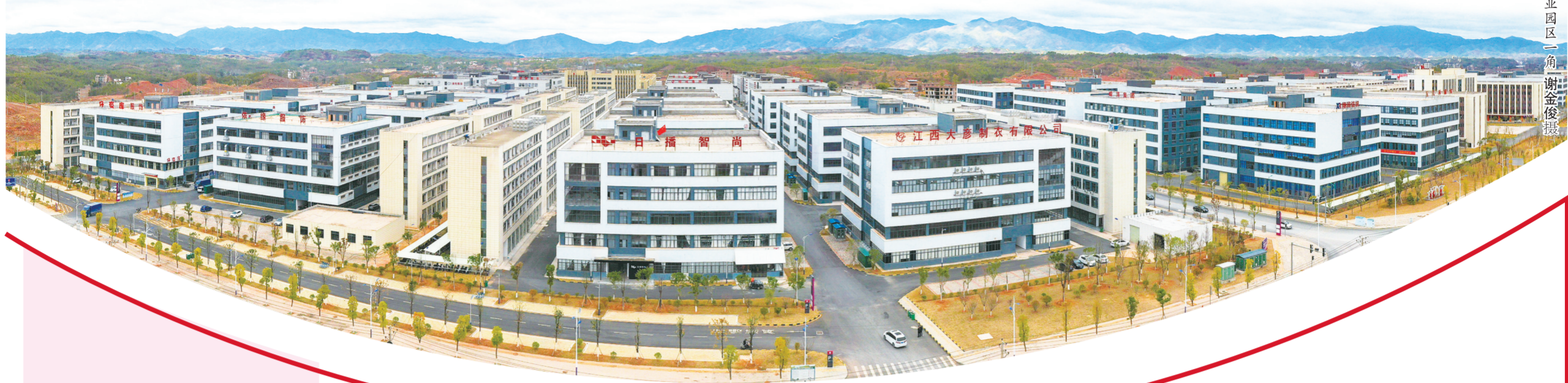
工业园区一角

富硒蔬菜大棚硕果累累、纺织服装产业蓬勃发展、红色旅游井喷式增长……仲夏六月，行走在于都城乡，处处呈现欣欣向荣的景象。