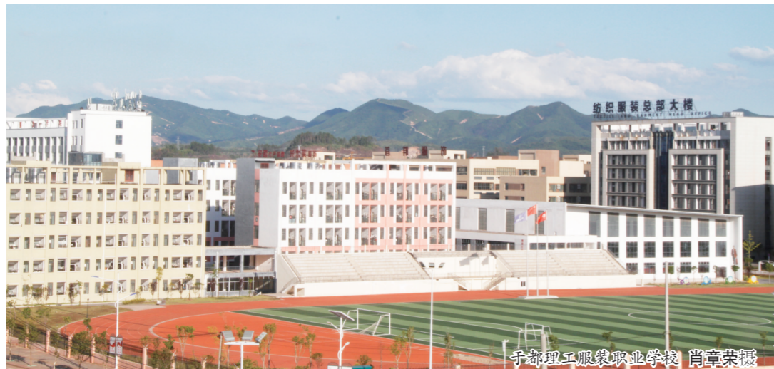
于都理工服装职业学校