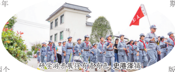
研学活动开展得有声有色

据于都县文化广电新闻出版旅游局主要负责人介绍，近年来，于都把红色旅游融入大规划，将红色旅游业与工业与现代农业、休闲观光农业相结合，不仅发展了红色旅游，还带动了工业旅游、乡村旅游、生态旅游融合发展，形成了以中央红军长征出发地纪念馆为核心、多个精品区域为支撑的“众星拱月”全域旅游发展架构。（宋嘉华/文）