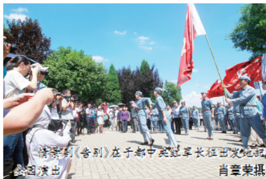
情景剧《告别》在于都中央红军长征出发地纪念馆演出