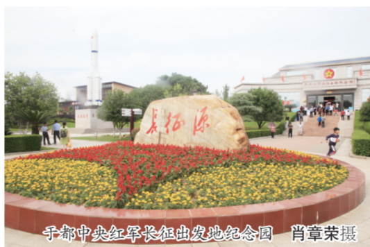
于都中央红军长征出发地纪念馆

近年来，于都把纺织服装定位为首位产业，聘请中国服装行业协会专家团队编制《于都县纺织服装产业发展规划》，致力于打造千亿级产业集群；聚焦纺织服装产业链“强链、补链、延链”，全面加强建设智造基地、设计中心、展销中心、检测中心、物流中心、面料辅料市场、服装学校等“十大公共平台”；持续提升园区平台承载力和集聚力，园区面积从原来的5.3平方公里扩展至11.3平方公里；先后投入71亿元，完善园区水、电、路等基础设施建设，推进园区产城融合；为首位产业发展提供完善配套，总部大楼、设计中心已建成使用，水洗产业园、展销中心、FDC面料辅料数字图书馆等已经投入使用。