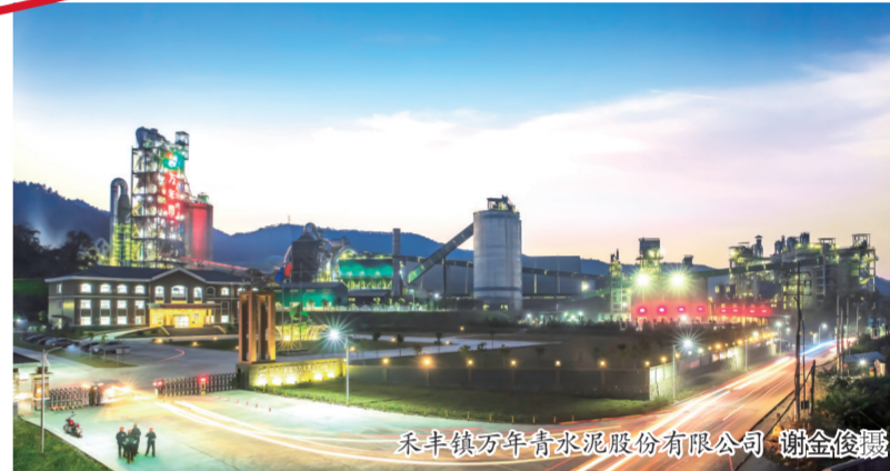
禾丰镇万年青水泥股份有限公司

强化党员管理，助推作用发挥。于都县创新党员“四式”管理，通过“目标式”管好先锋型党员、“引导式”管好完成任务型党员、“服务式”管好力不从心型党员、“跟踪式”管好丧失作用型党员，全面提升党员整体素质。充分发挥党员先锋模范作用，有效激发党员先锋模范的内生动力。截至目前，全县共培育党员致富项目513个，党员致富带头人2626人，设立党员示范岗215个，选树宣传新时代赣鄱先锋14人；已建成89个乡村振兴示范点，第三批46个乡村振兴示范点正如火如荼建设中。