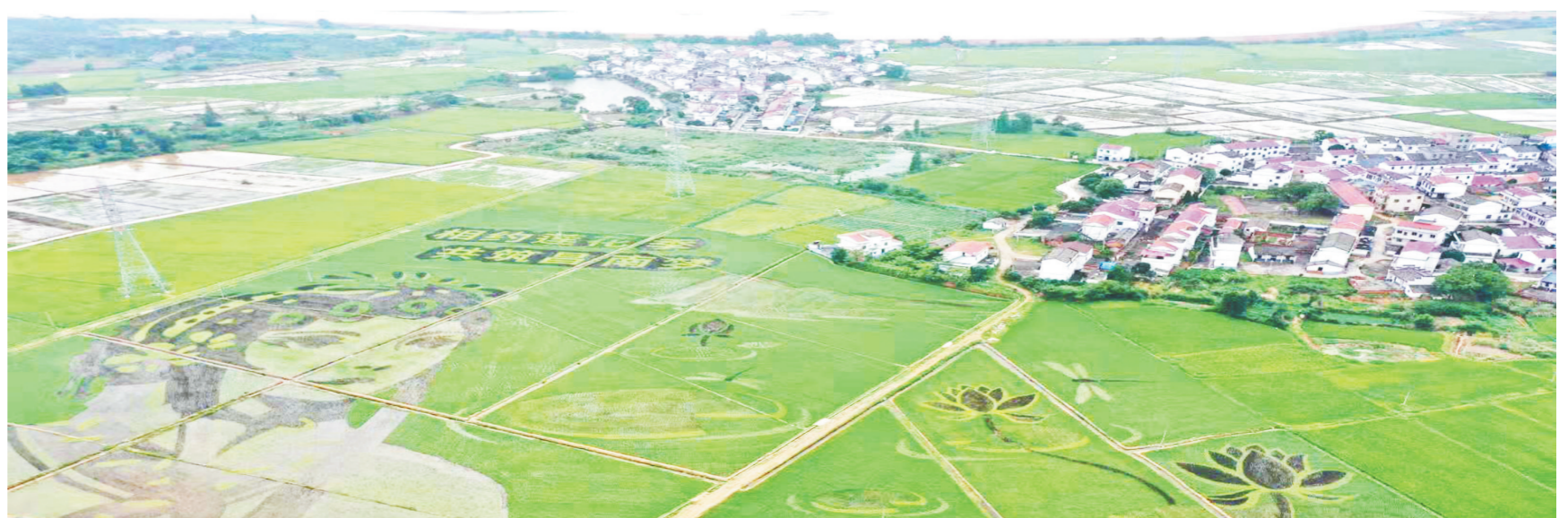
▼ 黄马乡大地艺术展