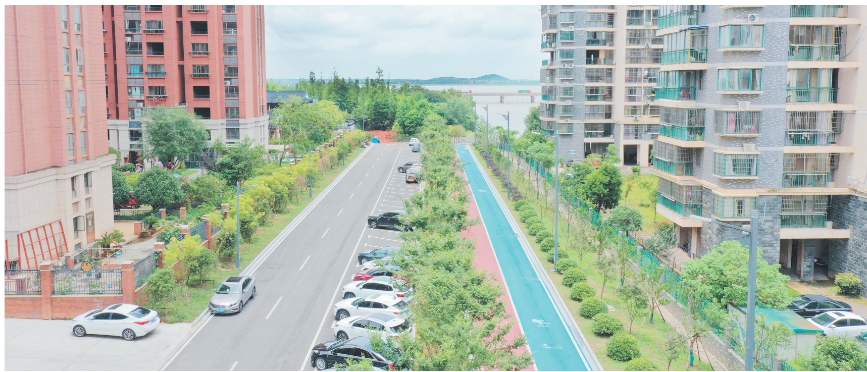
提升城市基础设施,打造宜居城市。图为青岚湖沿湖城市绿道

扎实推进党史学习教育,不仅要让广大党员在学习领悟中坚定理想信念、在奋发有为中践行初心使命,更要让群众分享高质量发展成果、共享高品质幸福生活。进贤县在党史学习教育中,大力推进“清正进贤”“实干进贤”建设,全县党员干部以帮助企业解决实际问题为出发点,争相在“我为群众办实事”实践活动中展风采、拼奉献,不断提高群众的获得感、幸福感、安全感,持续为企业的发展蓄能量、提效率、加速度,塑造进贤新形象,推动进贤新发展。