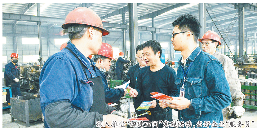
深入推进“四进四问”实践活动,当好企业“服务员”

网区”,配备专职帮办、导办工作人员,全面实行“一窗受理,同步审批,一窗发证,三小时办结”制度,进一步提升企业开办便利度。 为发展而奋斗,为民生而奔波。在进贤的大地上,“我为群众办实事”实践活动不断走深走实。