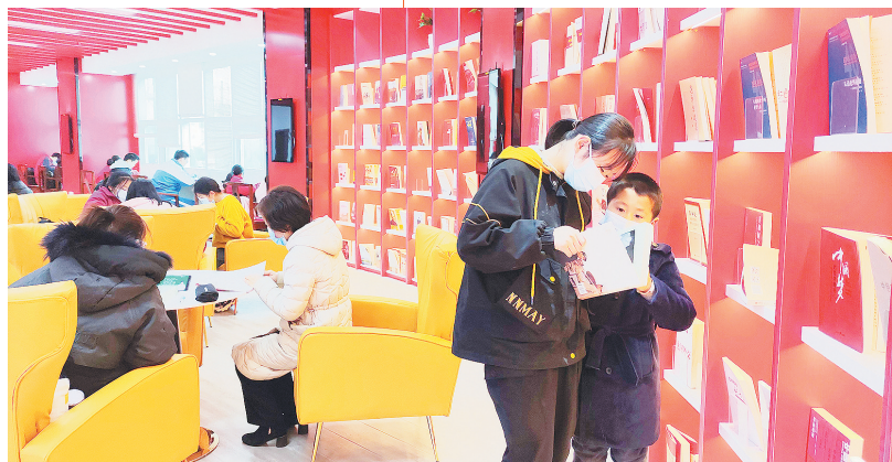
县图书馆 加大文化惠民力度。图为进贤建设秀美乡村,提升群众幸福感。图为李渡镇栽西村

确定的10件政府民生实事大票项目:新建进贤一中附属幼儿园、基础教育网点提升(民和一小、三小)、公共文化基础设施提升(青岚美书馆)、进贤县中医院防控救治能力提升、打造2个“1+5+X”社区邻里中心(农夫路社区、胜利路社区)、对沿水岸人行步道进行打造(森林公园至水上公园段绿道提升)、对凤凰街区域内老旧小区进行改造,以及打通城市断头路(街巷五路、街巷二路)、农村公路提升改造(前坊镇至西湖李家)、新建进贤县职工运动馆。