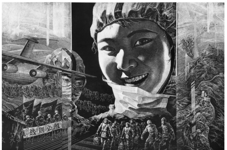
黑白木刻《中国战“疫”》严恩浩作