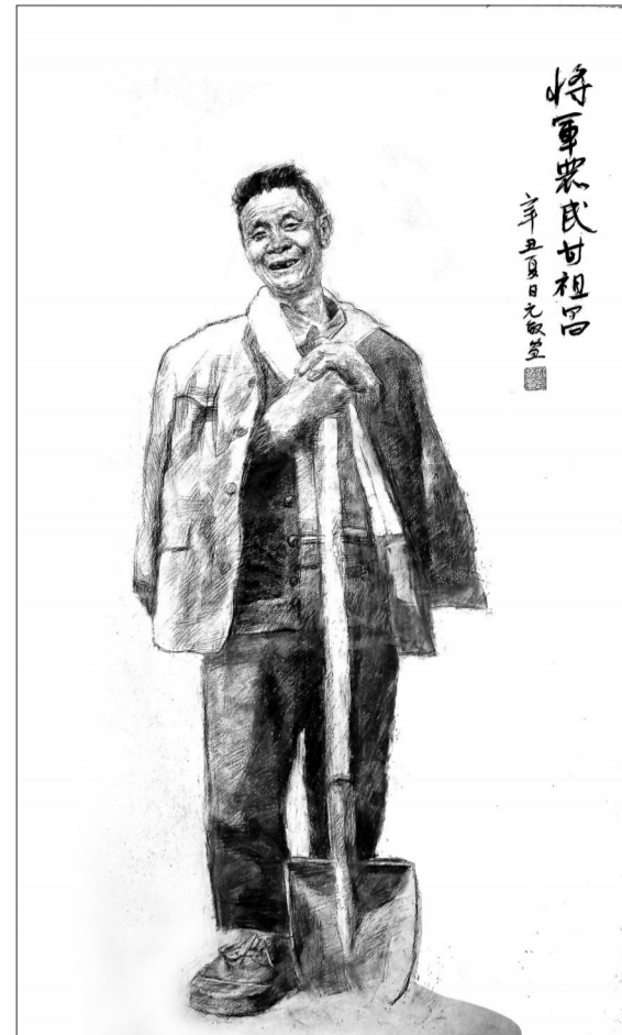
素描《“将军农民”甘祖昌》刘元敏绘