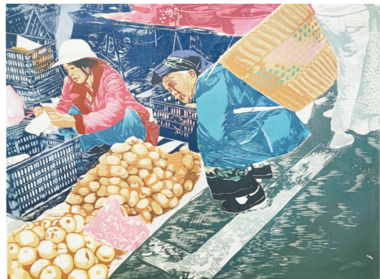
绝版油印《生活之二》王慧敏作