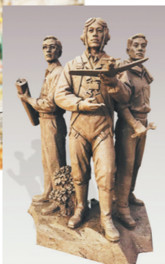
雕塑《勇拓天疆》泥稿正照