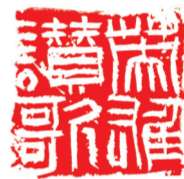
篆刻《英雄赞歌》陈维刻