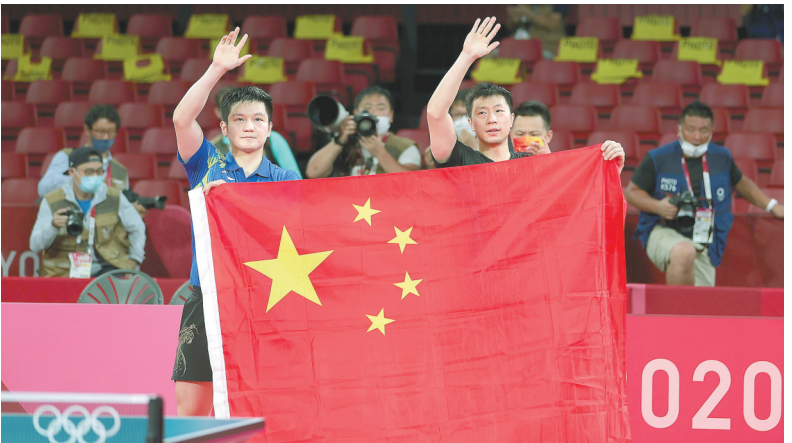
乒乓球——马龙夺得男单冠军 7月30日，马龙(前右)和樊振东在比赛后共展国旗。当日，在东京奥运会乒乓球男子单打决赛中，中国选手马龙战胜队友樊振东，夺得冠军。