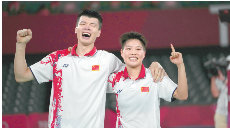
羽毛球——混合双打：王懿律/黄东萍夺冠 7月30日，王懿律/黄东萍(右)庆祝夺冠。当日，在东京奥运会羽毛球混合双打决赛中，中国选手王懿律/黄东萍战胜一对中国选手郑思维/黄雅琼，获得冠军。