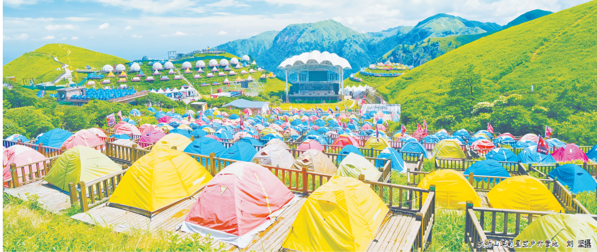
武功山武功山户外营地