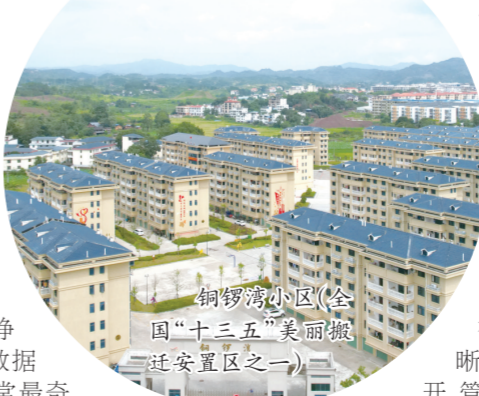
铜锣湾小区（全国“十三五”美丽搬迁安置区之一）

前路任重道远，更需策马扬鞭。石城县城投人将继续坚持“团队做优、城市做美、国资做大、企业做强”的总体运营目标，以“最好的服务、最优的质量”赢得广阔市场，以主人翁的奋斗姿态，奋力跑出国有企业高质量发展的“城投速度”，为奋力谱写全面建设社会主义现代化国家石城新篇章作出新的更大贡献。