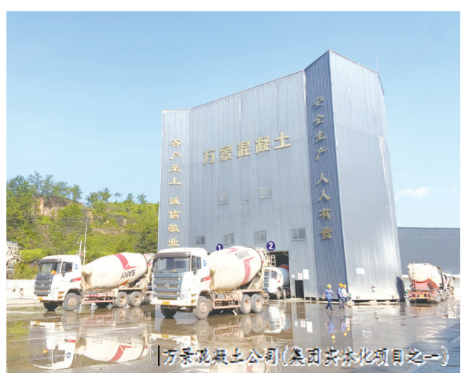
万景混凝土公司（集团实体化项目之一）