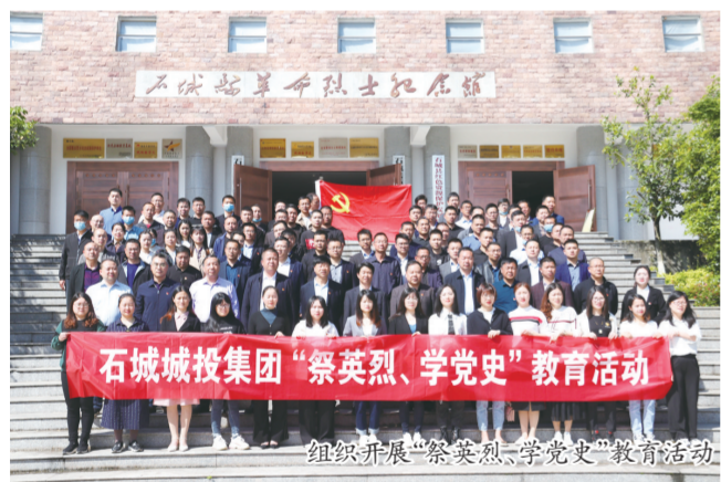
组织开展“祭英烈、学党史”教育活动