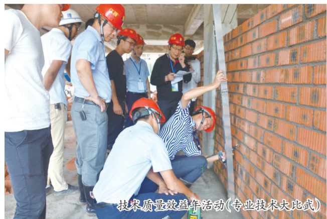
技术质量双提升活动（专业技术大比武）