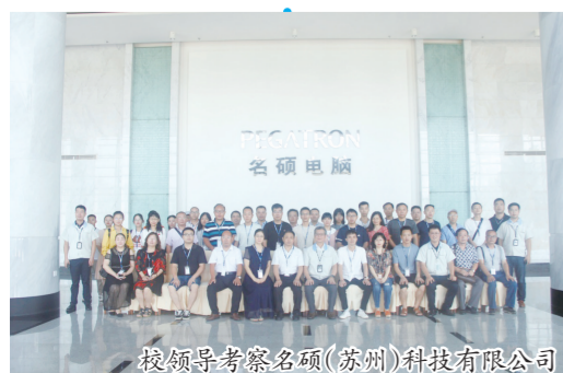
校领导考察名硕(苏州)科技有限公司