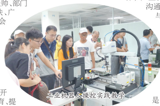
工业机器人操控实践教学

学校坚守“一切为了学生”的育人理念，始终把学生就业工作放在最优先、最核心的位置，为毕业生精心挖掘、认真筛选最优质、最具前景的就业岗位。今年以来，学校领导先后与上海地铁、苏州地铁和名硕科技(苏州)有限公司进行对接，就人才培养和产业发展情况进行了沟通交流，让合作企业深度参与学校人才培养和专业建设，联合开展订单式培养。数据显示，近年来，学校毕业生一次性就业率均稳定在98%以上。