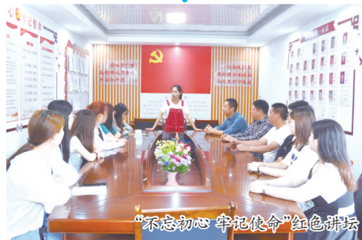
“不忘初心 牢记使命”红色讲坛

她，就是江西电子工业中等专业学校。近年来，学校先后被评为“江西省示范中等职业学校”“计算机信息高新技术考试站”“江西省再就业培训基地”“江西省继续教育培训基地”“江西省劳务输出基地”“全国家电维修办学先进单位”。秉持着拳拳匠心，在红土地上谱写了技能人才培养的崭新篇章。