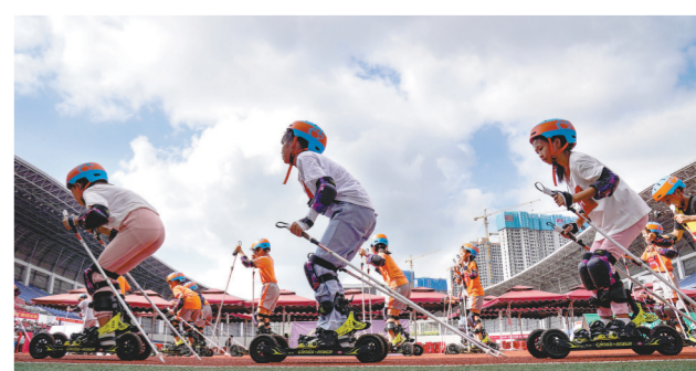
近日，‘奔跑吧·少年’2021年全国青少年万人滑启动仪式暨‘新长征杯’全国青少年冰雪(滑轮)邀请赛在都县举行。