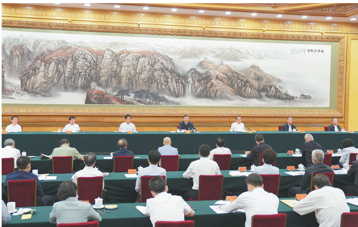
8月27日至28日,中央民族工作会议在北京召开。中共中央总书记、国家主席、中央军委主席习近平出席会议并发表重要讲话。