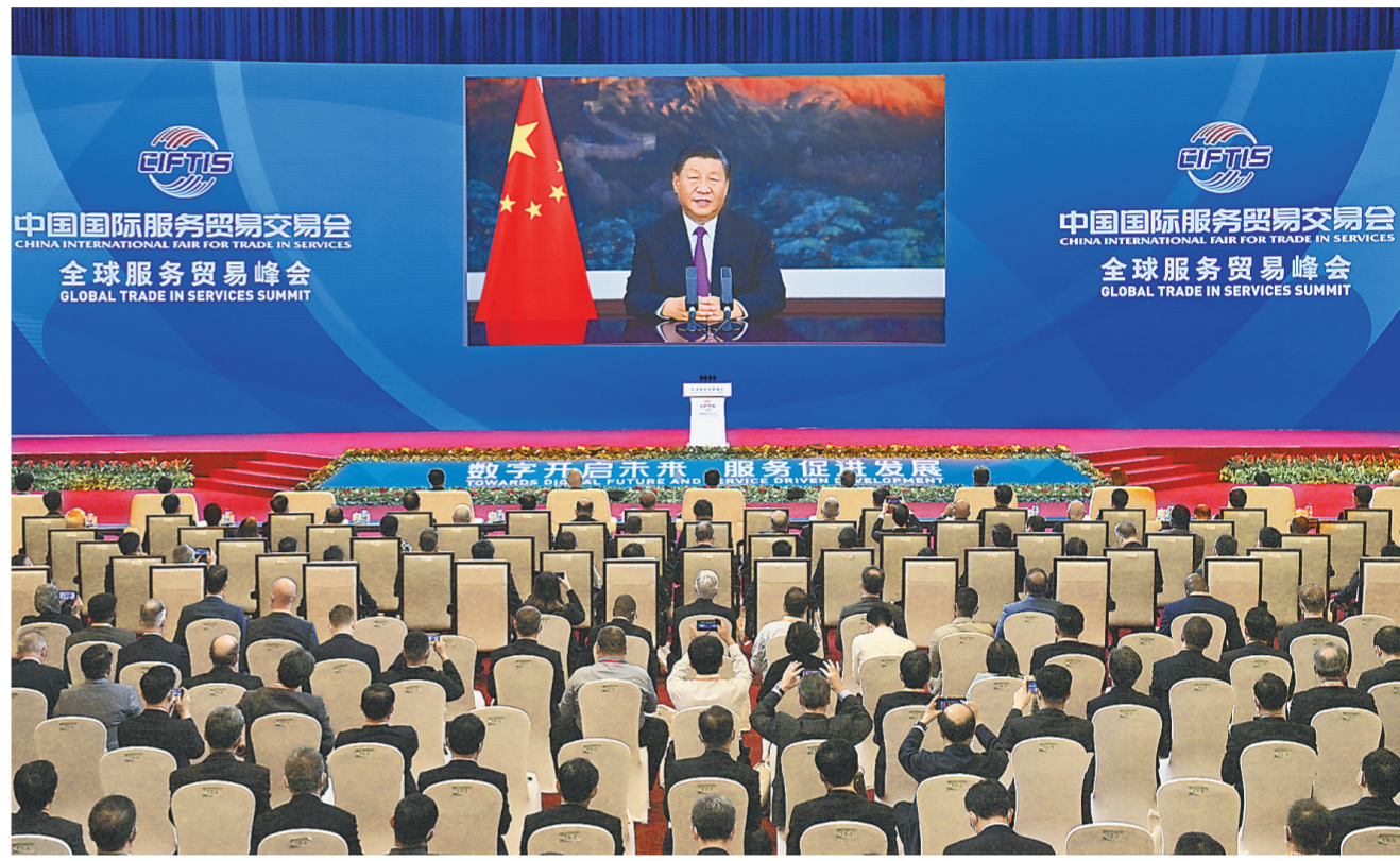
9月2日晚,国家主席习近平在2021年中国国际服务贸易交易会全球服务贸易峰会上发表视频致辞。