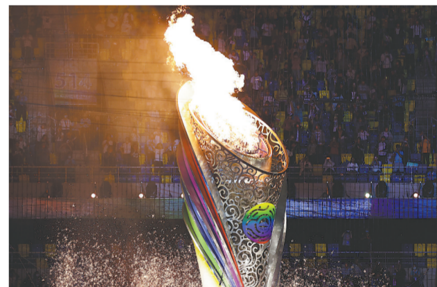
9月15日,主火炬被点燃。当日,第十四届全国运动会开幕式在西安奥体中心体育场举行。

“全民全运,同心同行”,在十四运会主题口号的感召下,体育健儿心手相连砥砺前行,点燃了神州大地的运动激情,凝聚起中华儿女的民族豪情。镌刻着奋进与希望的“旗帜”握在手上,“复兴之火”在盛世“绽放”,承载着同心共筑体育强国梦的巨轮,此刻正扬帆远航。(新华社西安9月15日电)