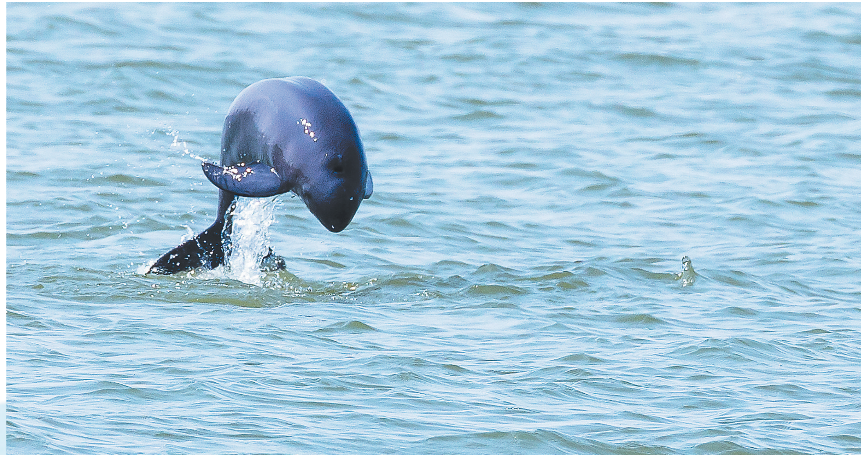
9月16日，在南昌市东湖区扬子洲镇渔业村赣江段，一头长江江豚在赣江撒欢。