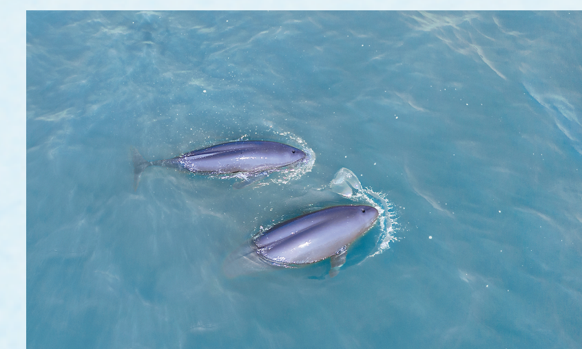
两头长江江豚同时出水呼吸。