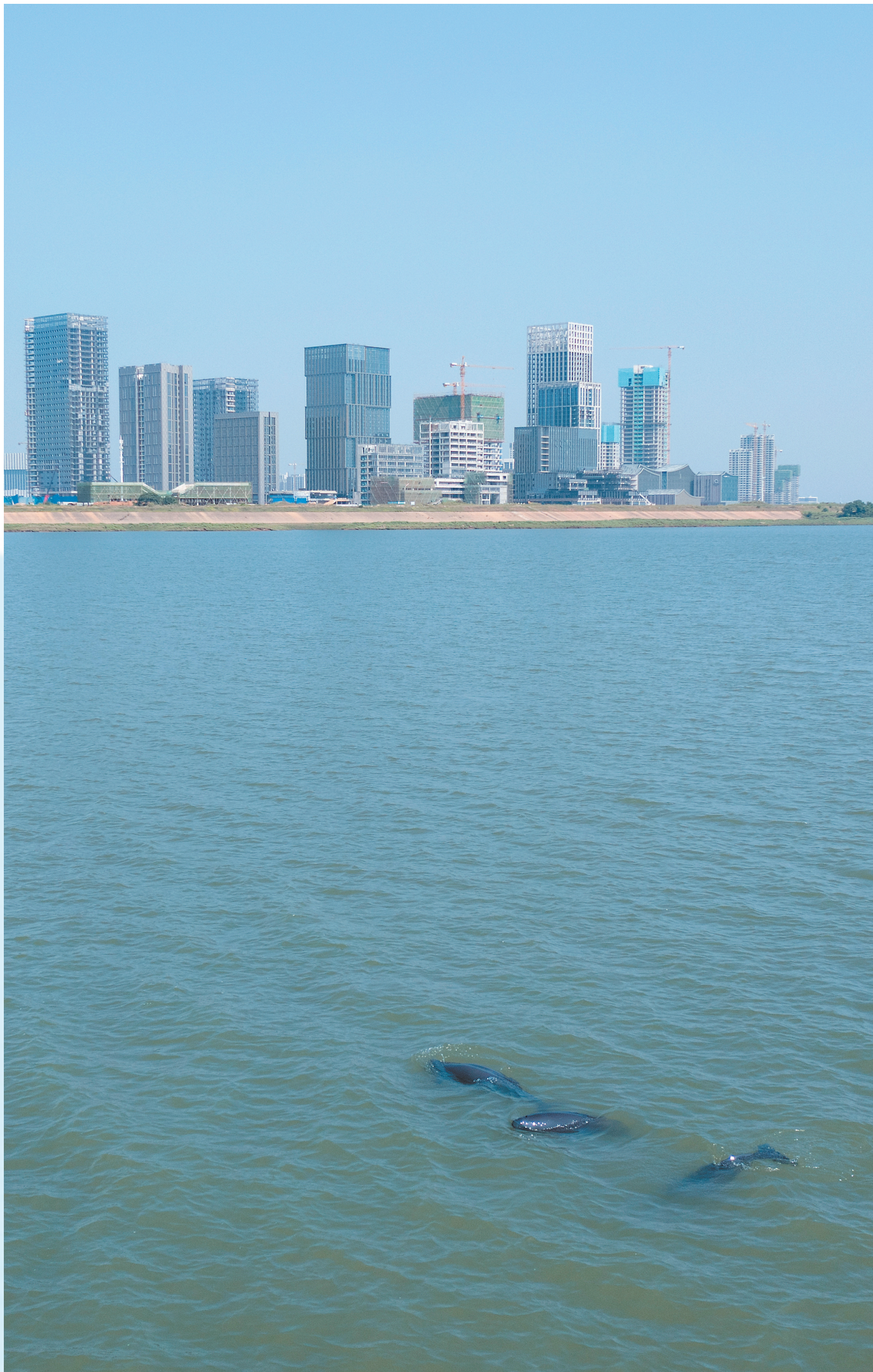
9月15日，一群水中嬉戏的长江江豚和岸上的高楼大厦相互映衬。