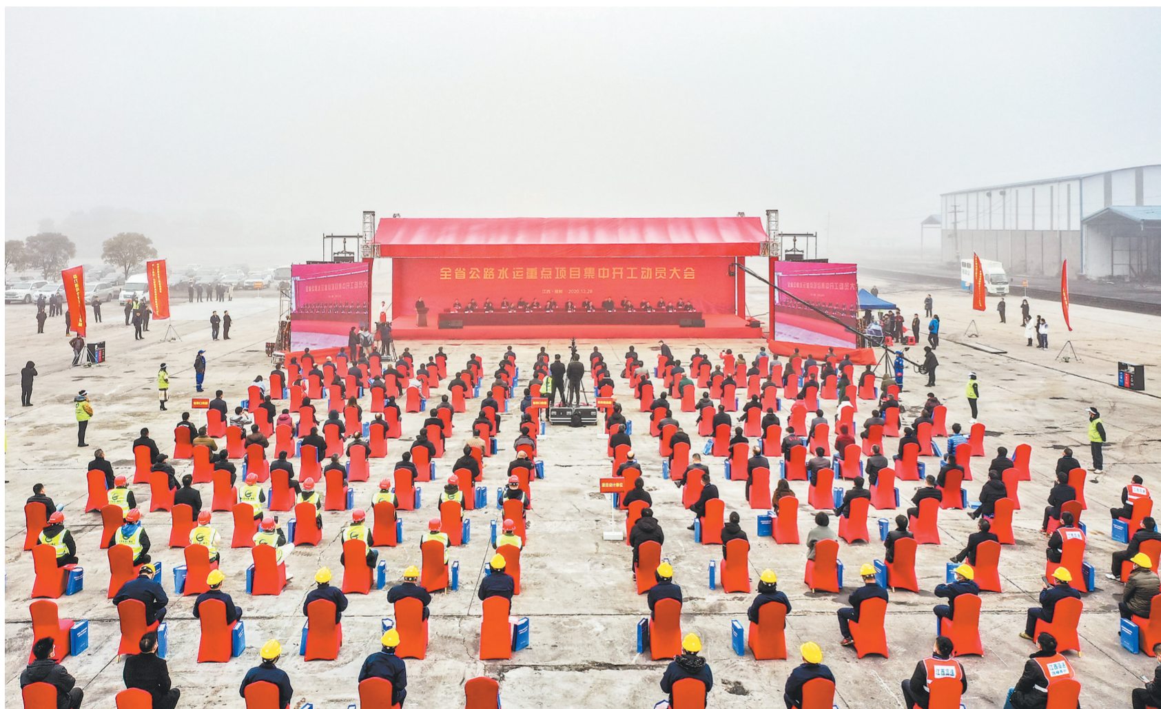
2020年12月28日,全省公路水运重点项目集中开工动员大会在樟树河西码头举行,一次性集中开工6个码头项目。