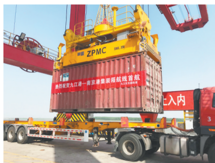
2021年5月1日,九江红光国际港正式开通至南京港集装箱内贸航线。

省港口集团自成立以来,按照省委、省政府决策部署,着力做好港口水运建设、运营、管理三篇文章,不断完善公司治理体系,系统谋划企业改革创新和公司高质量发展,为助力交通强省建设贡献港口力量。