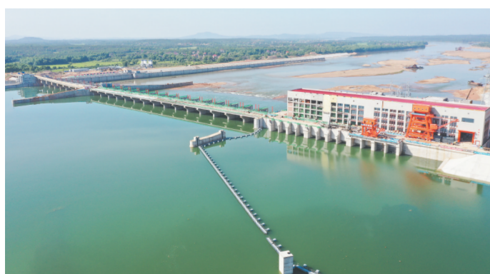
2021年9月17日,赣江井冈山航电枢纽工程4号机组成功并网发电。