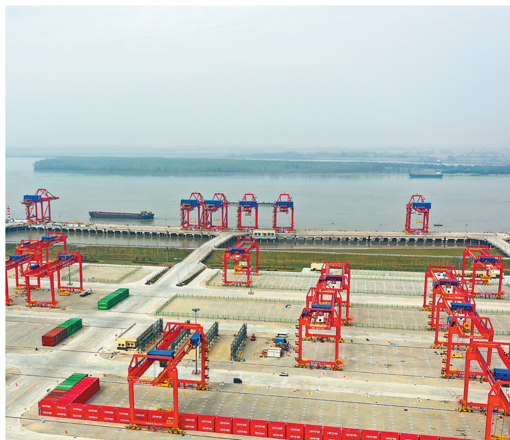
2020年10月28日,九江红光国际港正式开港,该码头目前是我省规模最大标准最高集装箱码头。