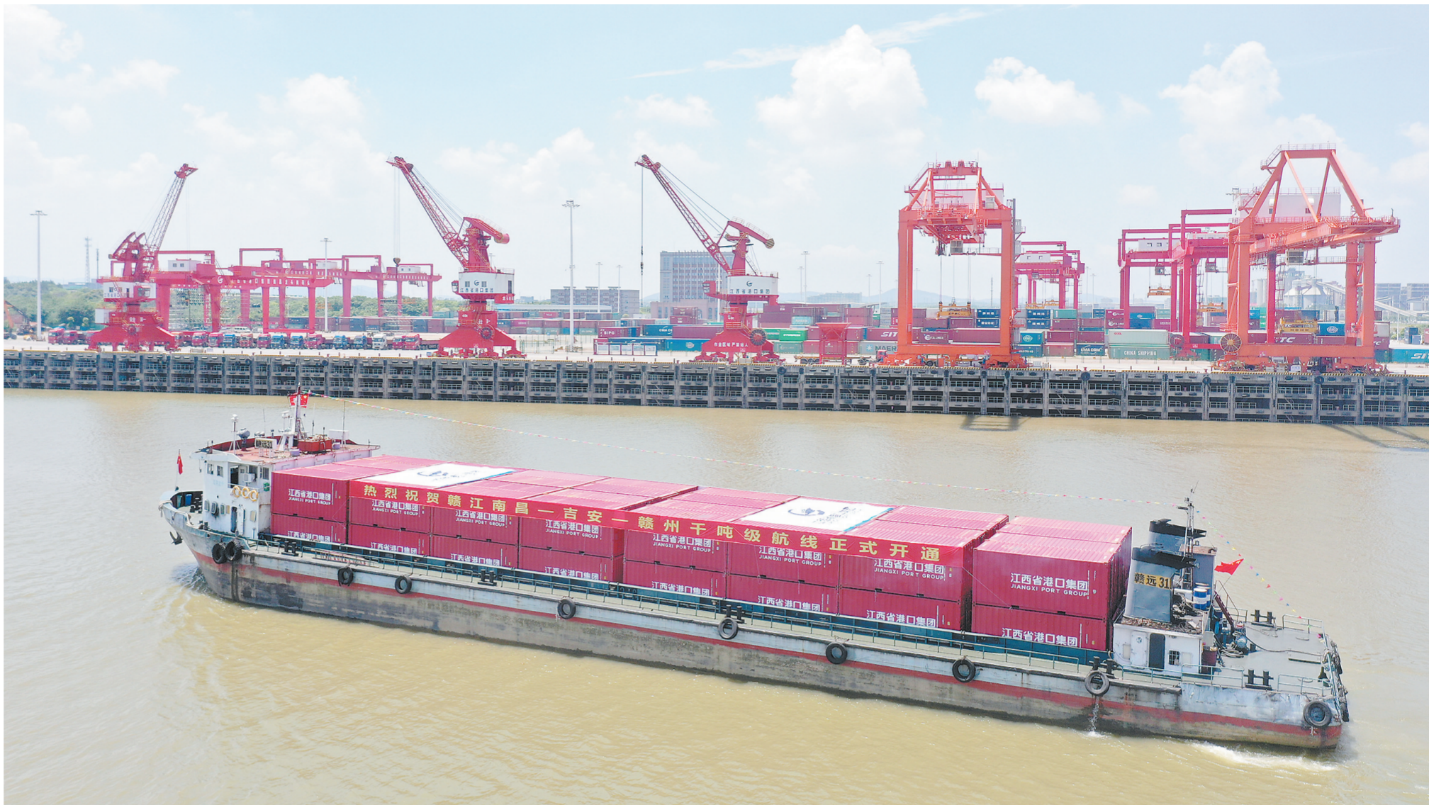
2021年6月22日,省港口集团所属的赣31号船舶满载千吨货物,从南昌龙头岗码头起航开往赣州,标志着赣江南昌—吉安—赣州千吨级航线正式开通。