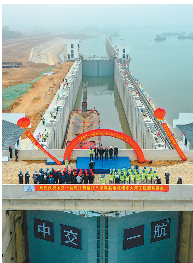
2020年12月28日,信江八字嘴航电枢纽船闸试通航完成。