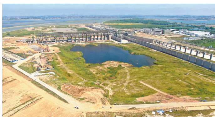
2021年,信江双港航电枢纽项目施工现场。