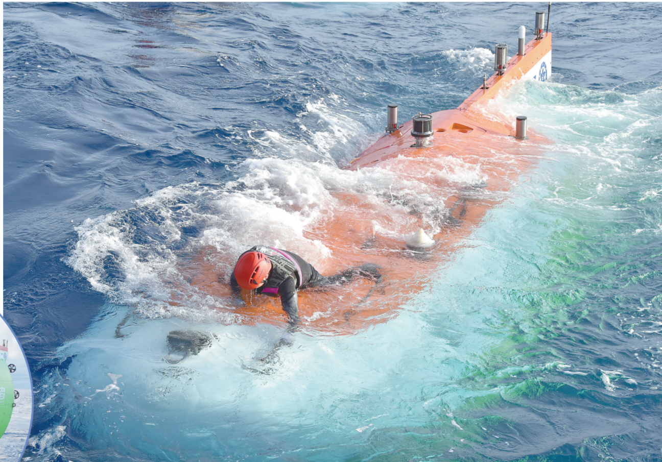
“奋斗者”号在西太平洋即将入水。