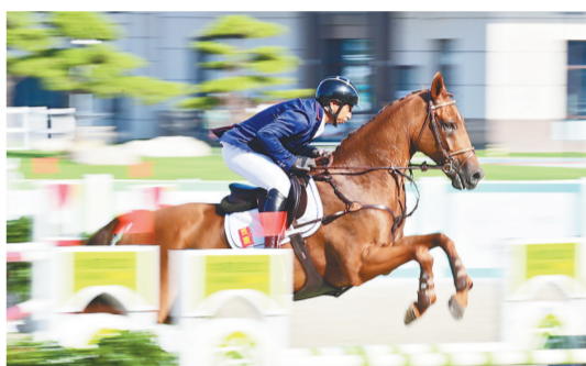
9月21日,马术比赛正在进行场地障碍赛。