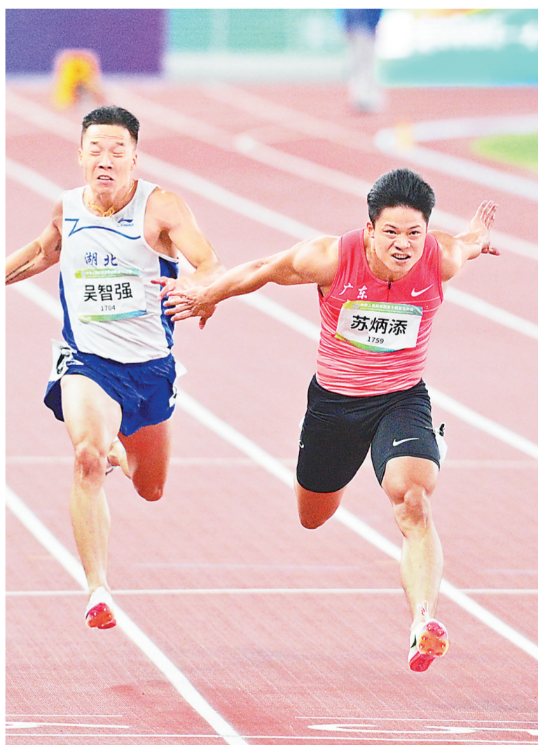
9月21日,广东队选手苏炳添在西安奥体中心体育场进行的全运会男子百米决赛中,以9秒95的成绩夺得冠军,且创造了新的全运会百米纪录。