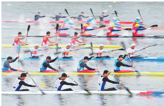
9月24日,皮划艇比赛你追我赶。