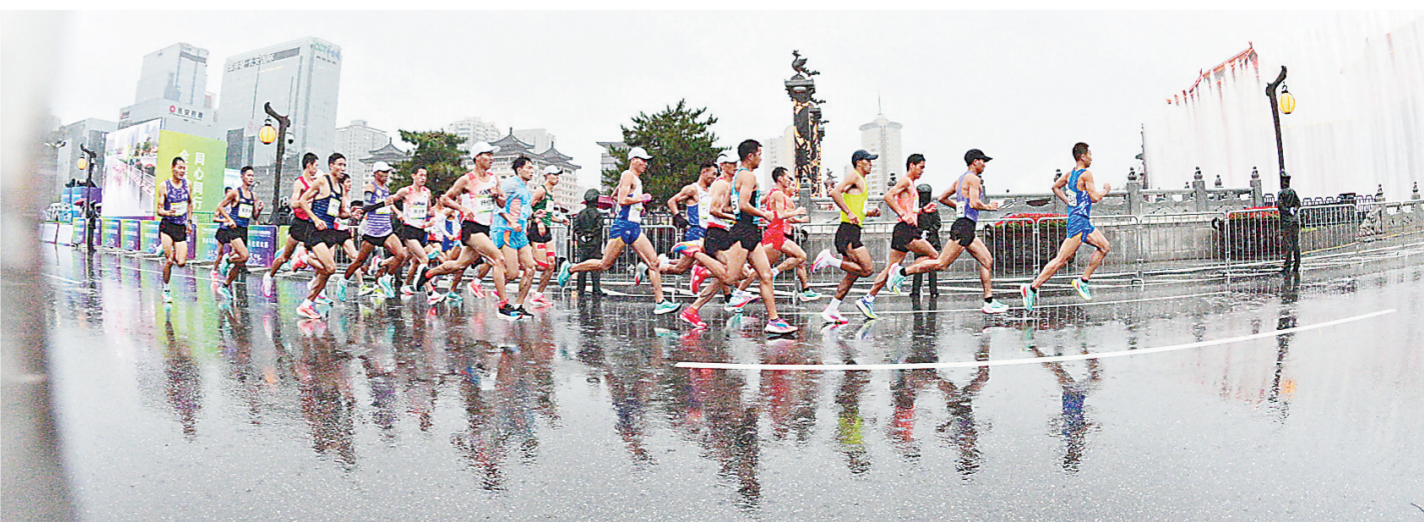
9月26日,雨中马拉松比赛。