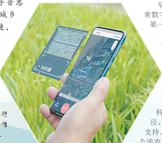
这是网商银行首创的卫星遥感信贷技术“大山雀”。