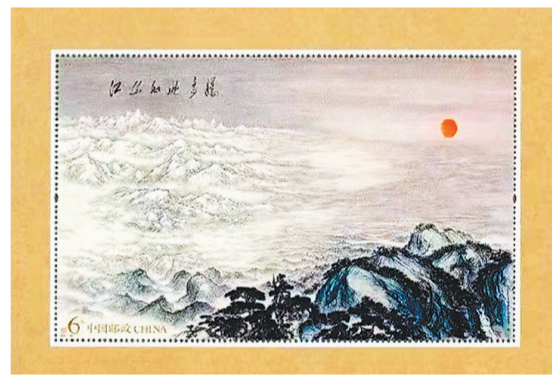
邮票小型张《江山如此多娇》

“江山就是人民,人民就是江山。”为献礼党的百年华诞,祝福伟大祖国繁荣昌盛,中国邮政于9月25日发行《江山如此多娇》特种邮票小型张(如上图)。此邮票由设计家王虎鸣设计。邮票采用平面设计手法,展现了《江山如此多娇》原画全貌,边饰衬以淡雅的传统纹饰,烘托出原画的壮丽雄阔、气势苍茫,整体设计简洁大方,画面效果厚重古雅。