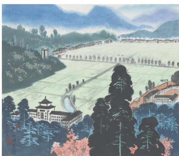
版画《井冈山茨坪》(1978年)