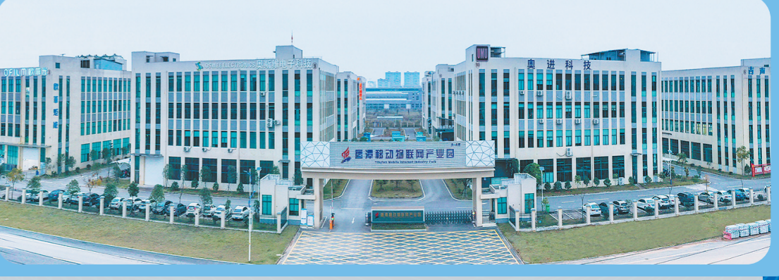
鹰潭移动物联网产业园