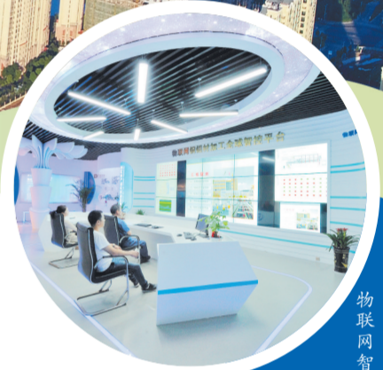
物联网智控平台助力铜产业发展