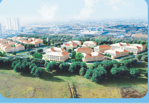
鹰潭市智慧科创小镇