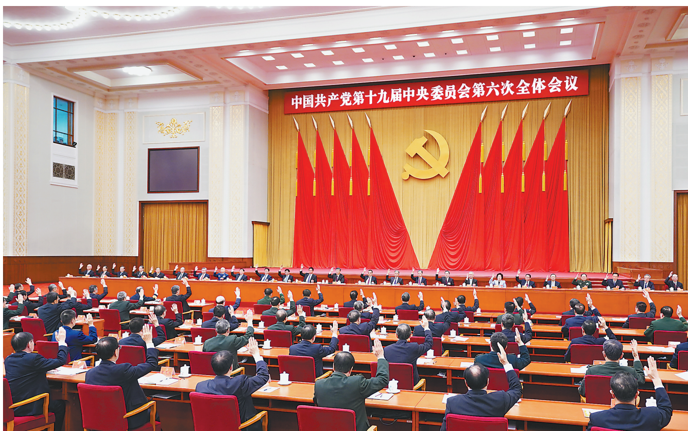
中国共产党第十九届中央委员会第六次全体会议,于2021年11月8日至11日在北京举行。中央政治局主持会议。