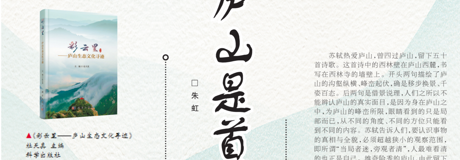
▲《彩云里——庐山生态文化寻迹》 杜天真 主编 科学出版社

庐山是“世界文化景观”“世界地质公园”，被联合国教科文组织评价为中华文明的发祥地之一。这里不仅历史悠久，人文厚重，而且生态优美，是举世公认的生物多样性宝库，与江河湖海襟连，中心地区的森林覆盖率超过90%。历史上，众多名人雅士登临庐山、研究庐山，其成果主要表现为诗歌。据统计，共有三千五百多位名人，写下了一万六千多首诗歌，咏唱庐山。我认为，其中写得最好的有五首。