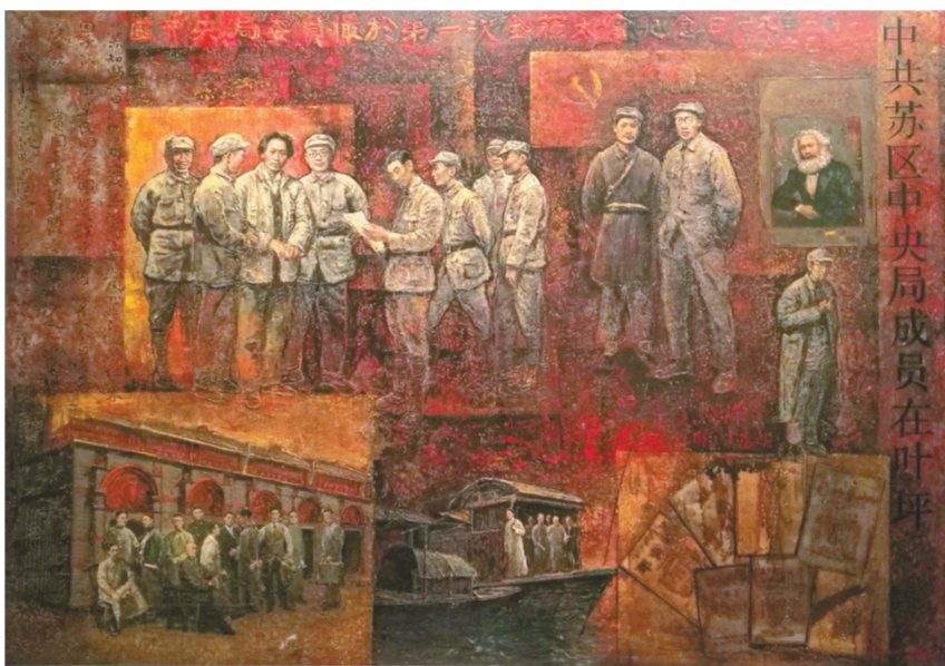
图③: 漆画《信念——党的历程》王向阳绘