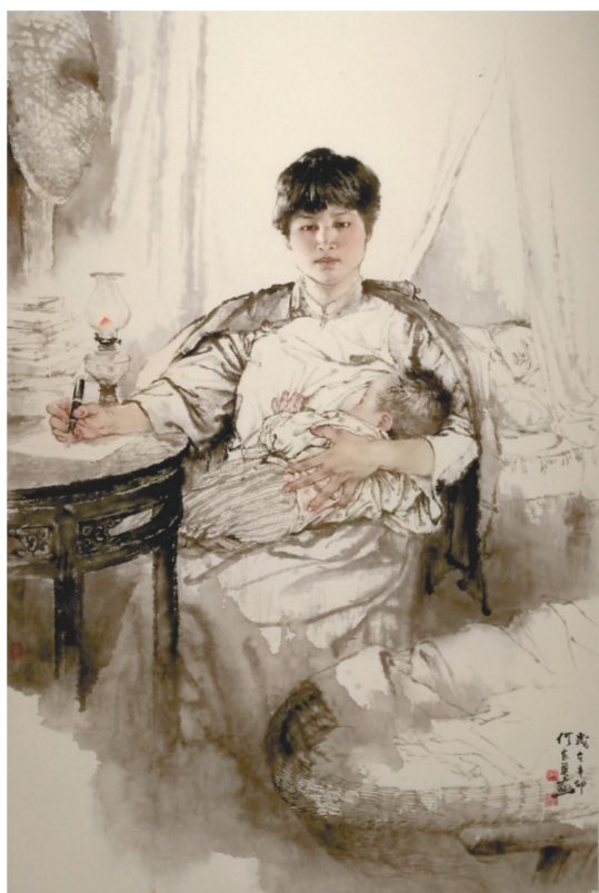
图④: 国画《杨开慧》何家英绘