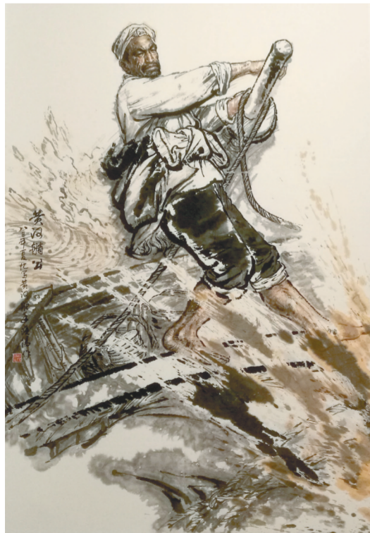
图①: 国画《黄河船公》杨晓阳绘