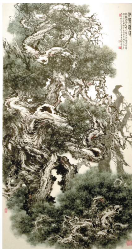
图⑤: 国画《洪荒雄魂》张介宇绘