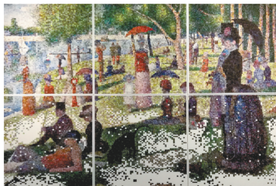
数码版画《共享时代·大碗岛的星期天上午》王世航作