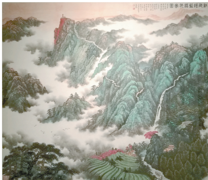
图⑥: 国画《红色摇篮 绿色家园》王林森绘