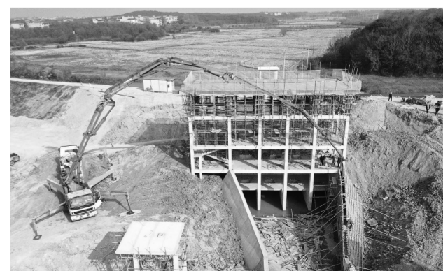
12月10日,余干县九龙镇船山电排站正在积极施工。该县积极落实各级河湖长制,千方百计筹集资金用于单圩堤除险加固,目前已筹集资金1.5亿元,对老旧电排站进行改造,提高排涝能力。

本报九江讯(记者周亚婧)截至12月16日,九江市柴桑区、德安县、都昌县和湖口县4区(县)已完成2022年度《江西日报》等党报党刊征订任务。