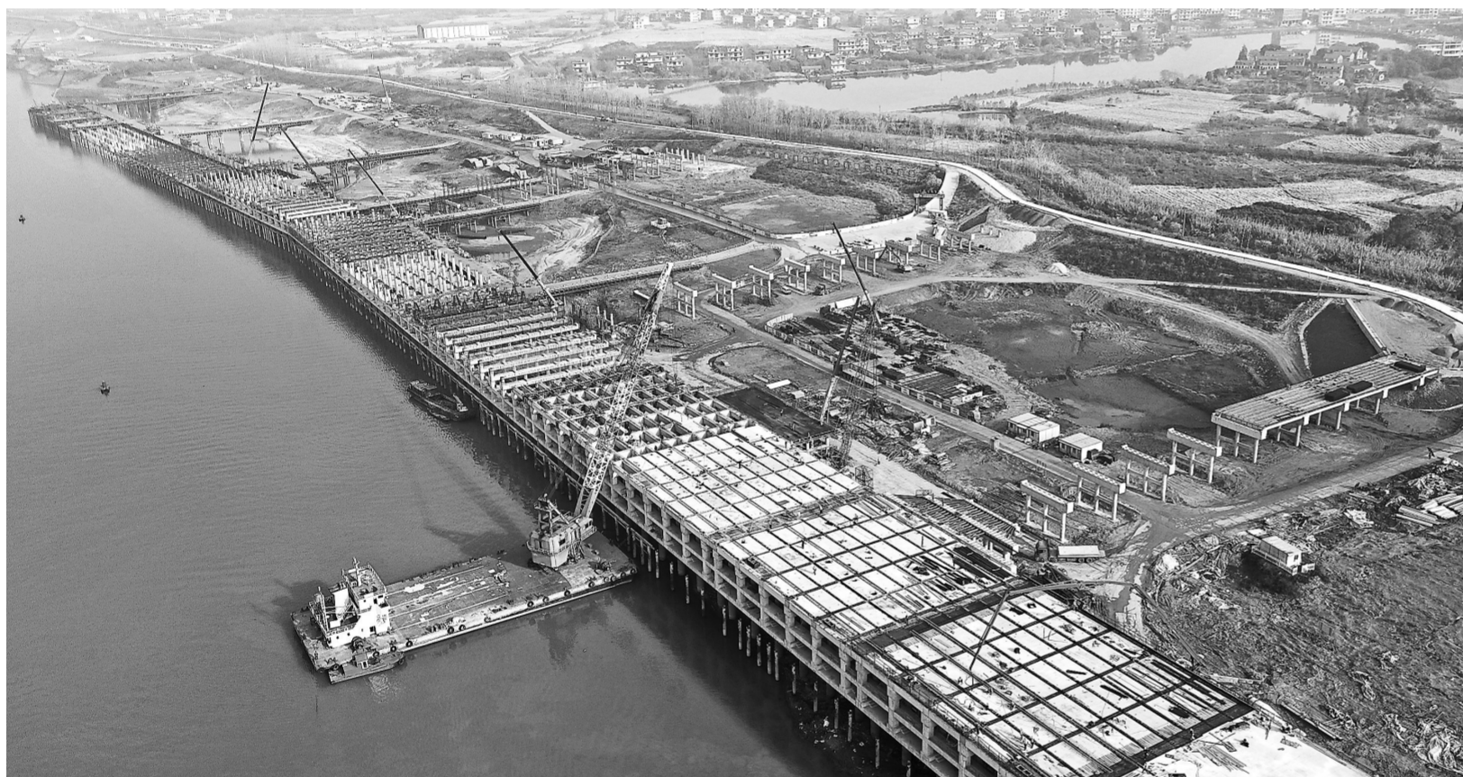
码头建设热火朝天

本报讯(殷琪惠 记者郑荣林)记者12月16日获悉,根据国家统计局江西调查总队对全省粮食作物开展的抽样调查,并经国家统计局核定反馈,2021年我省粮食总产量为438.5亿斤,比上年增长1.3%。