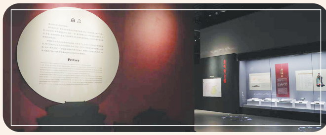
(图片为“大秦雄风——秦始皇兵马俑展”内景)