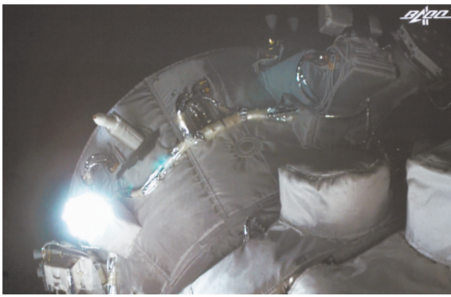
1月8日在北京航天飞行控制中心拍摄的神舟十三号航天员乘组进行手控遥操作天舟二号货运飞船与空间站组合体交会对接试验,天舟二号货运飞船与空间站组合体精准完成前向交会对接。