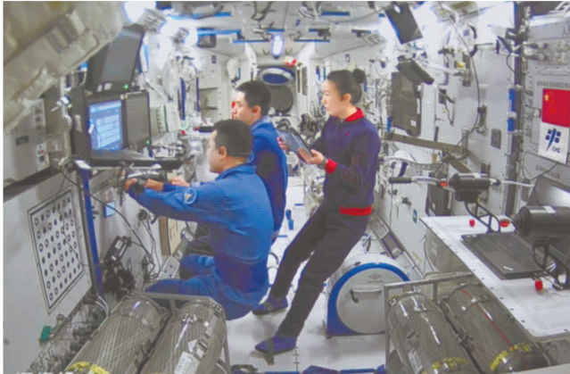
1月8日在北京航天飞行控制中心拍摄的神舟十三号航天员乘组进行手控遥操作天舟二号货运飞船与空间站组合体交会对接试验,航天员通过手控遥操作方式控制货运飞船。

试验开始后,天舟二号货运飞船从核心舱节点舱前向端口分离,航天员通过手控遥操作方式,控制货运飞船撤离至预定停泊点。短暂停泊后,转入