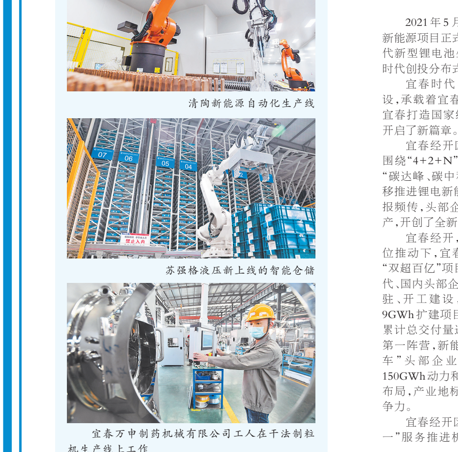
清陶新能源自动化生产线