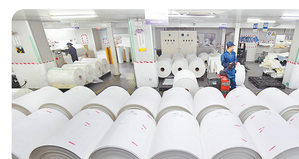
2021年哪吒汽车交付近7万台，稳居造车新势力第一阵营