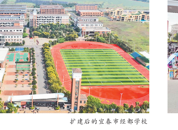
推行“五联动”工作机制，提升园区精细化管理水平

“两新”组织党建质量。积极探索锂电新能源产业链（供应链）党建联盟，构建“1+1+X+N”党建联盟框架，通过抓运行机制、要素集聚、服务保障，着力打破企业的围墙界限，打通锂电新能源产业上下游，加快全产业链联动、转型升级步伐。 坚持纵深推进全面从严治党。深刻汲取案件教训，扎实推进“以案促改、以案促治、以案促建”，持续深入抓抓实省委巡视、市委巡察及上级各类督查检查反馈问题整改，坚持“三重一大”和“民主集中制”建设，进一步扎紧制度笼子，持续抓好领导干部、企业家、高素质人才“三支队伍”建设，突出政治标准“六个一线”选人用人，坚定不移正风肃纪反腐，干部干事创业精气神加速提振，风清气正的政治生态持续稳固。 风清气正又始，勇立潮头谱新篇。展望新的一年，宜春经开区正以更加饱满的激情、更加务实的作风、更加负责的态度，秉持发扬为民服务孺子牛、创新发展拓荒牛、艰苦奋斗老黄牛的精神，按照宜春经开区不仅要成为推动宜春发展的引擎，也要成为推动全省发展的引擎”的全新使命和更高要求，披荆斩棘勇往直前，勠力同心在高质量跨越式发展道路上展现新作为、彰显新担当！