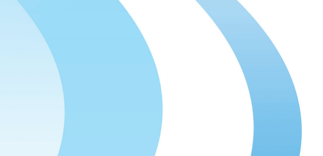
明冠新材生产车间

散性剂生产装置，申请专利达50余项；在第七十二届德国国际发明展上，南昌实业和霍夫曼研究院合作发明的“一种可杀菌自洁的纳米玻璃镀膜液”荣获金奖；在2020年全球工程机械50强峰会上，中天智联荣获2020中国塔式起重机械制造十强，获装配式建筑智能塔机行业标杆奖……一项项领先技术，勾勒出宜春经开区创新发展思路，也展现了产业技术从“跟跑”到“领跑”的跨越。 该区充分发挥企业主体作用，积极引导企业申报各项专利，发展成为“专精特新”“小巨人”企业和专注细分领域的“单项冠军”企业，创新培育成果斐然。2021年，全区新增科技部认定的国家高新技术企业11家，总数达到95家；新增种子独角兽企业1家、瞪羚企业2家、潜在瞪羚企业1家；新增国家级专精特新“小巨人”中小企业6家，新增省级专精特新中小企业9家，通过2021省级企业技术中心评价企业3家；为23家企业争取“科贷通”贷款8100万元，累计争取“科贷通”贷款1.55亿元。全区R&D经费投入占规模以上工业营业收入达2.7%。 产业的竞争，是人才的比拼，在强大的创新力量背后，是一大批科技人才的汇集。该区注重招商引资和招才引智“一推一引”同步推进，多次赴广东、福建、安徽、江苏、湖南等地开展人才招引和产业推介活动，吸引海内外优秀人才集聚园区。2021年，全区引进了江西省“双千计划”等省级以上重大人才项目10余人，省级人才项目14人，市级人才项目1人。让高层次人才把心留住、扎根宜春，人才集聚的“强磁体”正在加速发力。