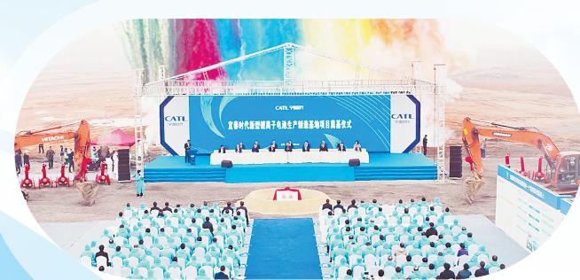
宜春时代项目奠基仪式

——2021年，围绕“4+2+N”现代产业布局，引进亿元以上项目35个，签约总金额497亿元。其中“152”项目9个，含“100”项目2个，“50”项目1个，“20”项目6个。 ——2021年，是宜春经开区发展史上的一个里程碑。宁德时代、国轩高科两个超百亿级项目落地经开，打造全球锂电新能源全产业链样板示范区迈出了坚实一步。在宜春市2021年度经济社会发展和党的建设情况巡查测评中，宜春经开区勇夺全市第一名，取得历史性突破。 …… 担当实干勇争先，昂首阔步开新局。一个个亮眼的数据昭示着，宜春经开区的高质量跨越式发展已经插上了腾飞的翅膀！