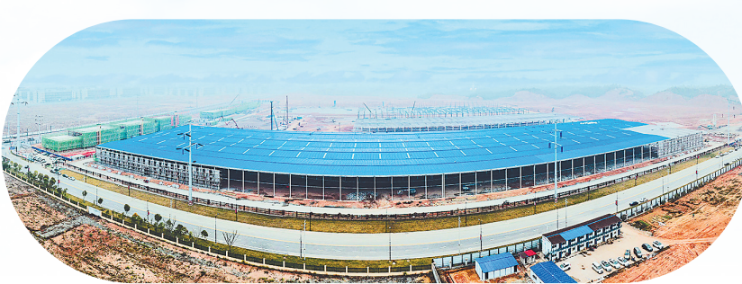
宜春国轩新能源产业基地项目正在加紧建设