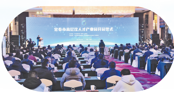
宜春市高层次人才产业园开工