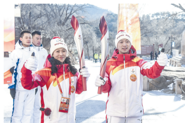
2月3日，火炬手马龙（右）和庞清在火炬传递中。当日，北京冬奥会火炬在北京延庆八达岭长城传递。北京2022年冬奥会将于2月4日开幕。

『能够参与其中，我深感荣幸！』 江西火炬手祝新根讲述心理历程 倪可心 本报记者 钟秋兰